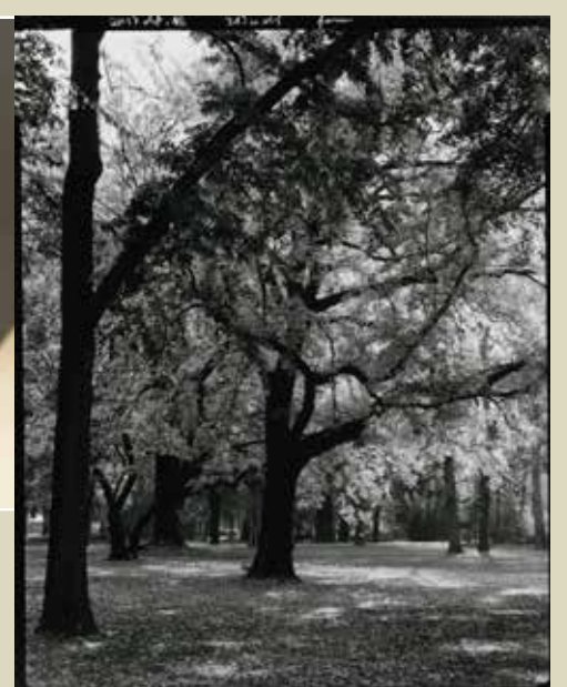
▶ A 6,1-es fényerejű Xenar objektív © Fotó Fejér Zoltán, Budapest, 2018 ▶ 4x5 inches síkfilmre a 210 mm-es Xenarral fényképezett próbafelvétel © Fotó Fejér Zoltán, Budapest, 2018