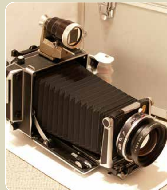
▶ Hosszú kihuzatot igényel a Linhofban a 240 mm-es Symmar © Fotó Fejér Zoltán, Budapest, 2018 ▶ 9x12 cm-es síkfilmre, a 240 mm-es Symmarral készített kép © Fotó Fejér Zoltán, Budapest, 2018