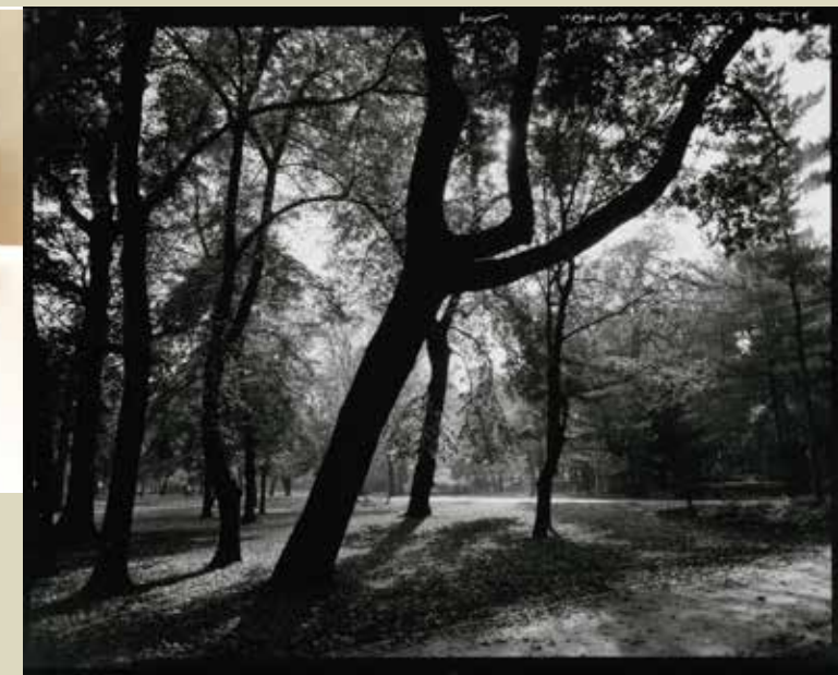
▶ A japán gyártmányú, 105 mm-es Tominon Linhof lapon © Fotó Fejér Zoltán, Budapest, 2018 ▶ A 105 mm-es Tominonnal 4x5 inchre fotózott próbafelvétel © Fotó Fejér Zoltán, Budapest, 2018