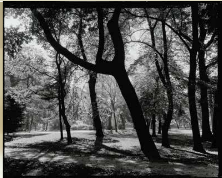
◀ Linhof Super Technika V-ös típusú fényképezőgép a Symmar normál objektívvel © Fotó Fejér Zoltán, Budapest, 2018 ▶ A 150 mm-es Symmarral 4x5 inches Foma síkfilmre készített próbafelvétel © Fotó Fejér Zoltán, Budapest, 2018