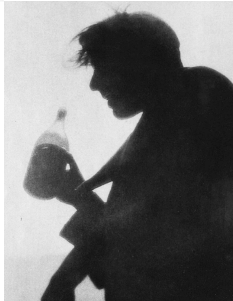
Kluger Zoltán: Az alkoholista , Das Magazin, 1929–1930/62. (okt.) 3998.

A Fotóművészet 2017/4. számában Somogyi-Rohony Zsófia beszámolója olvasható Kluger Zoltán budapesti kiállításáról. 1 Ez fontos hozzájárulás a Magyarországról eltávozott fotográfusok megismeréséhez. Mivel a kiállítás Izrael állam korai korszakából adott képet Kluger munkásságáról, érdemes visszatekinteni az ő korábbi fényképkészítő múltjára is. „Az 1920-as években Berlinben próbált szerencsét, ahol szabadúszó fotósként kereste kenyerét” – olvashatjuk az idézett cikk első oldalán.