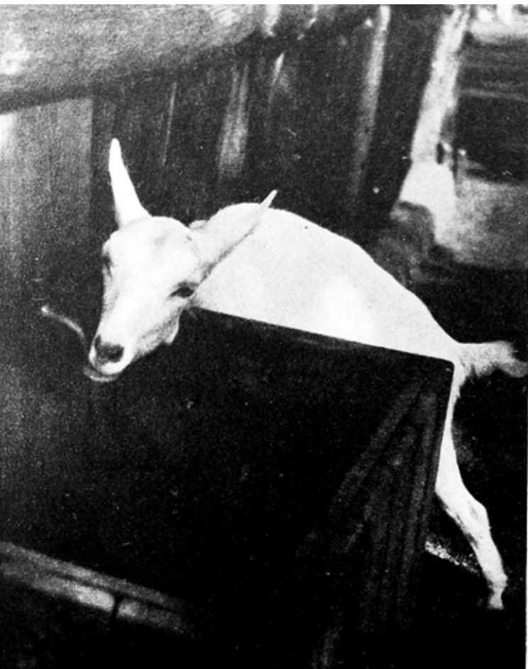
Kluger Zoltán: Szomjúság , Der Querschnitt , 1933/7. (okt.) 468. oldal utáni második műmelléklet