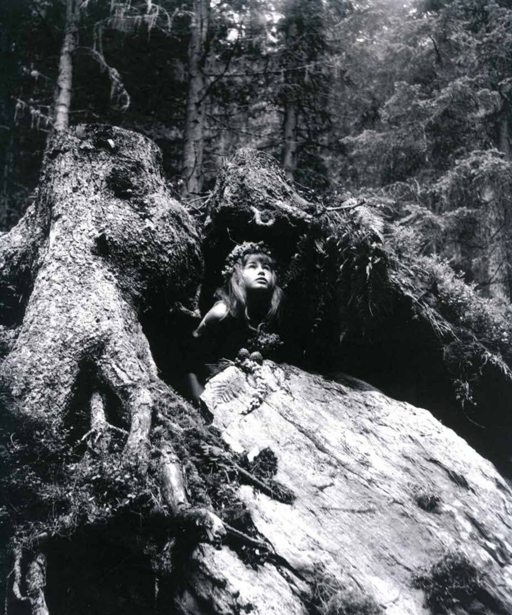
Ata Kandó: Álom az erdőben , 1954, -ferrotyped- ezüst zselatin print © Ata Kandó Estate, Nederlands Fotomuseum