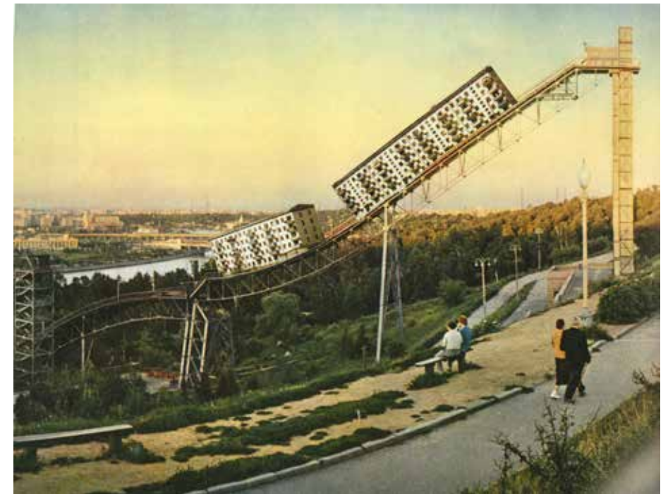
Tamara Stoffers: Sparrow Hills , 2016