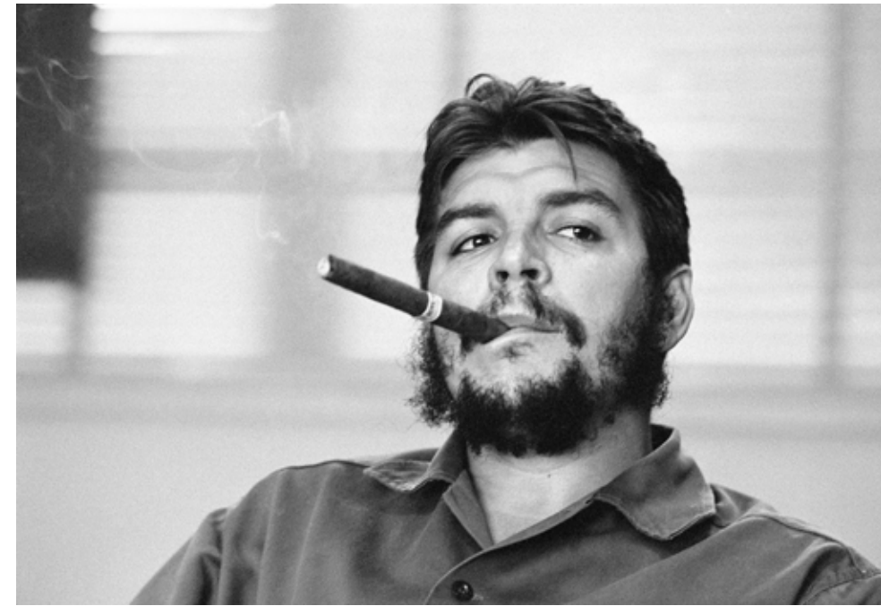
René Burri: Che , 1964, ezüst zselatin print © René Burri Estate, Magnum Photos, Bildhalle, Zurich