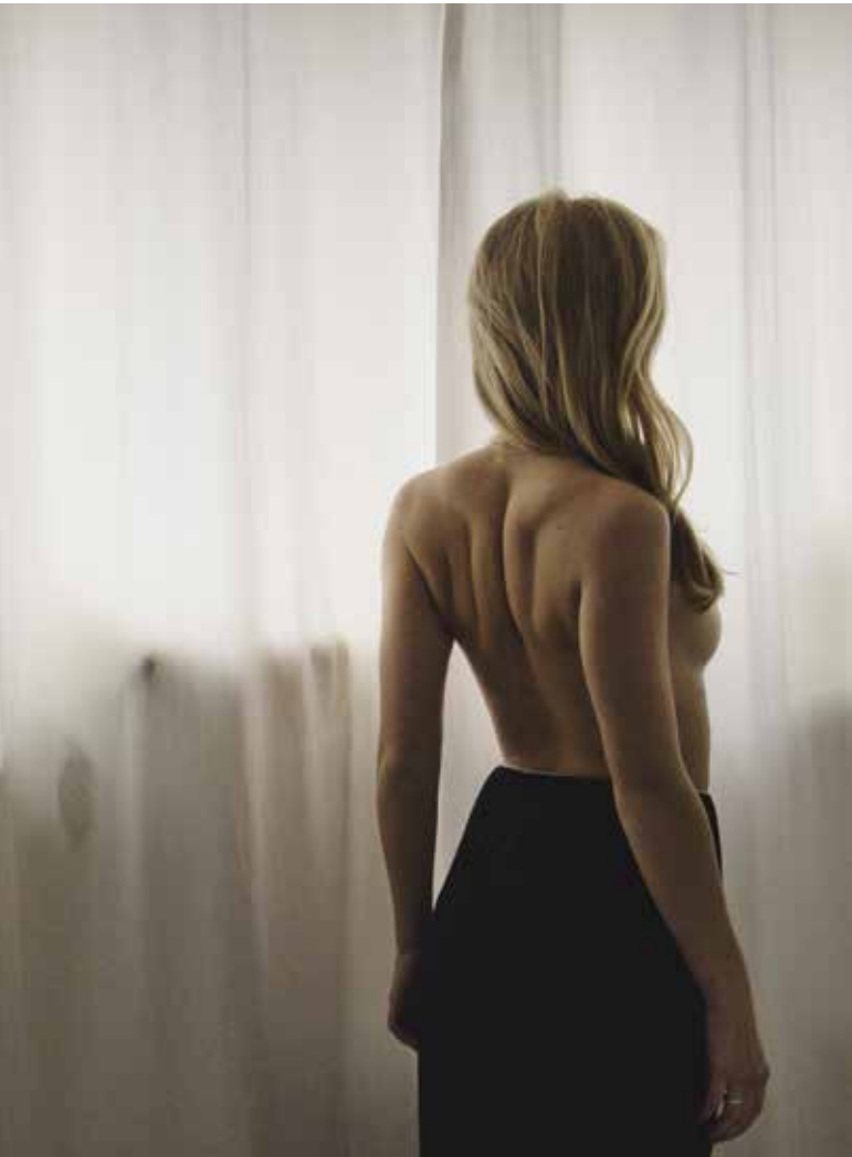
Peronne Pere: Volatile , 2014