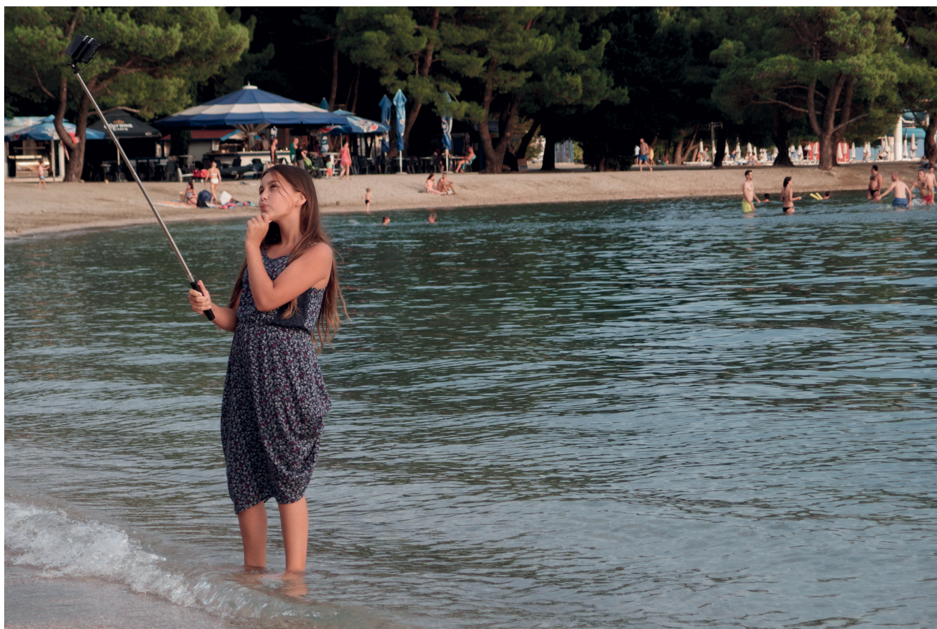
Szelfiző fiatal lány