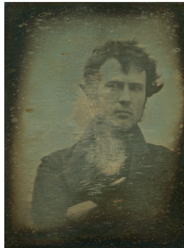
Robert Cornelius: [Önarckép], 1839, dagerrotípija (Library of Congress, American Memory)

https://commons.wikimedia.org/wiki/File:RobertCornelius.jpg