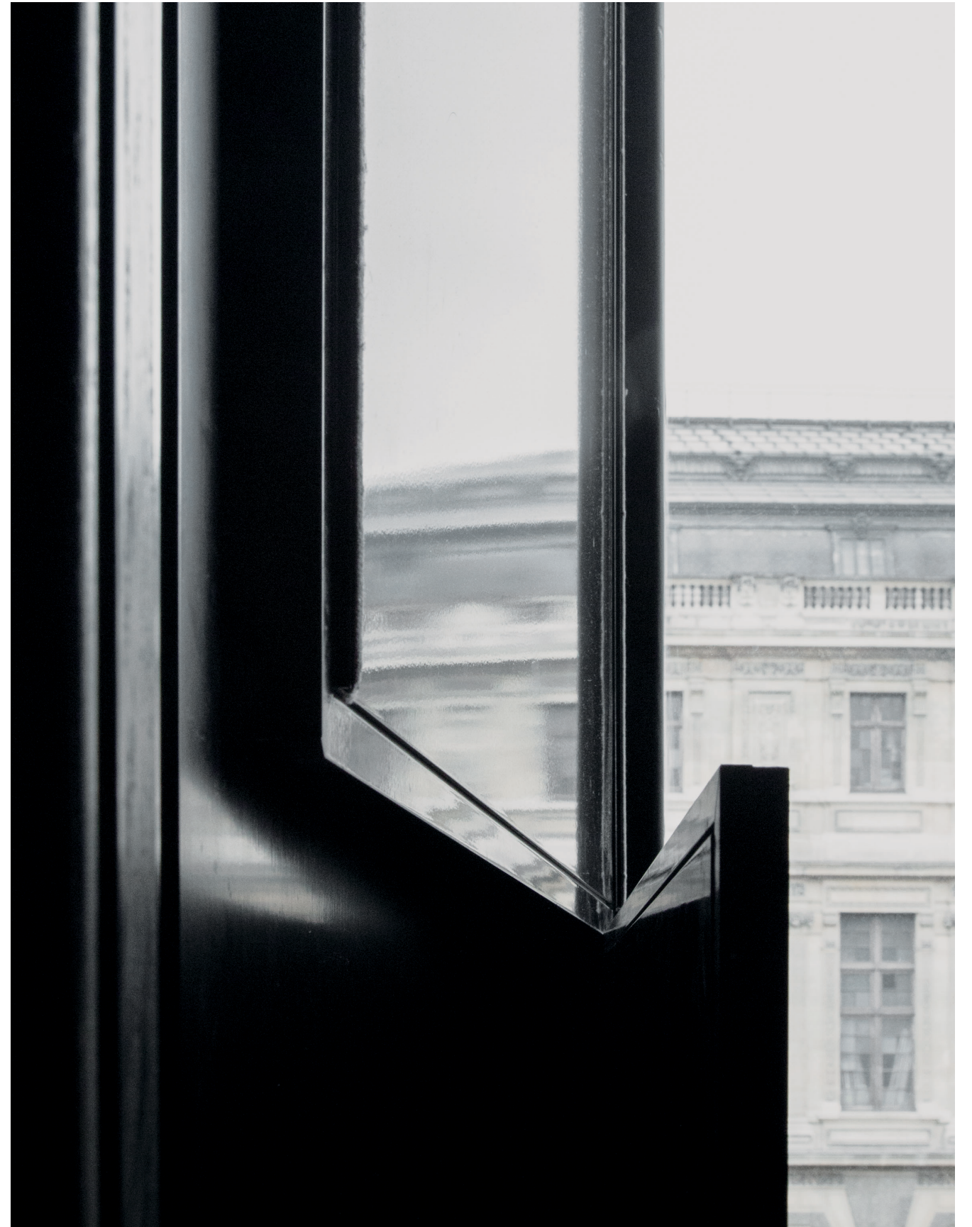
Le Louvre Paris, 2016