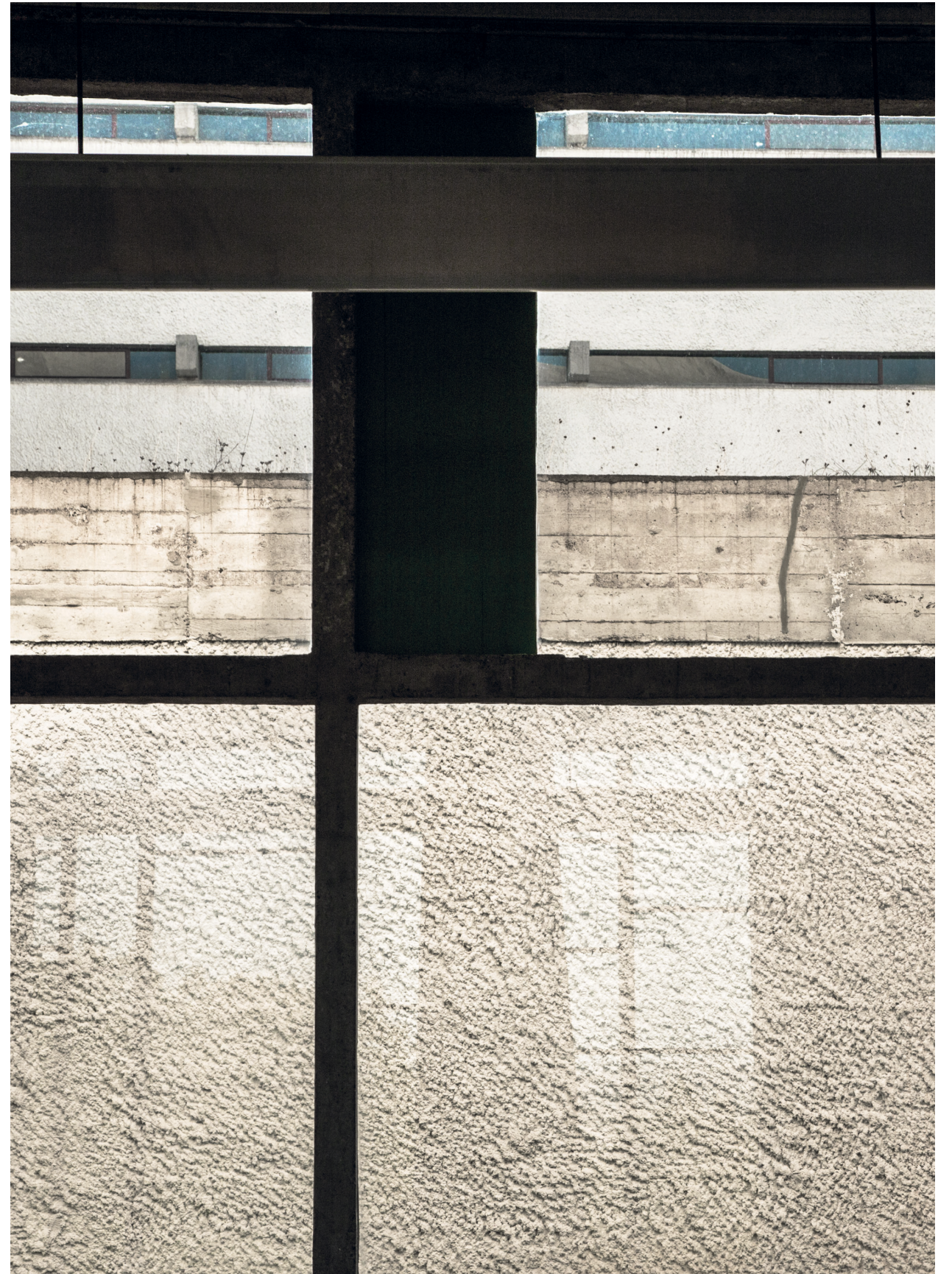
Le couvent de la Tourette, 2015