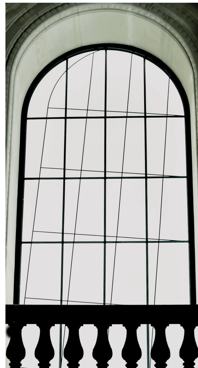
Le Louvre Paris, 2016