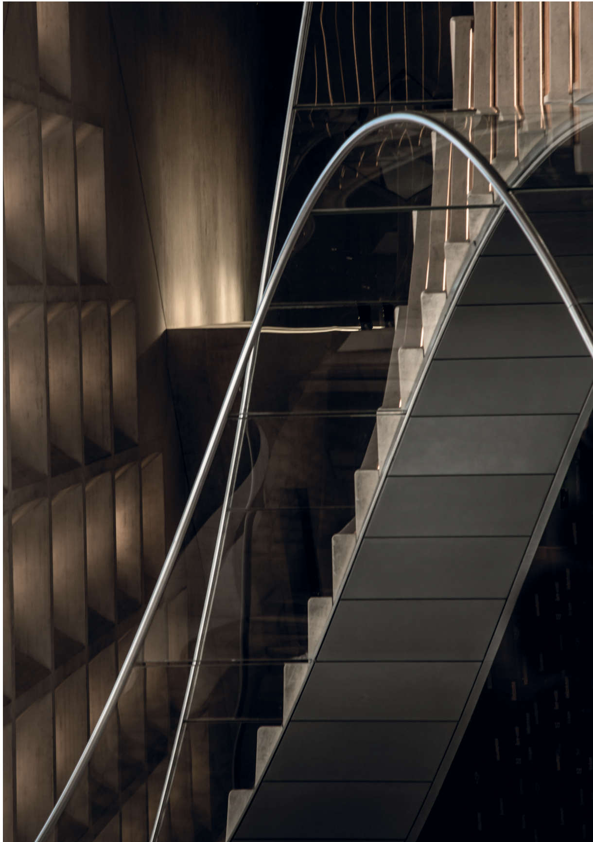
Le Louvre Paris, 2016