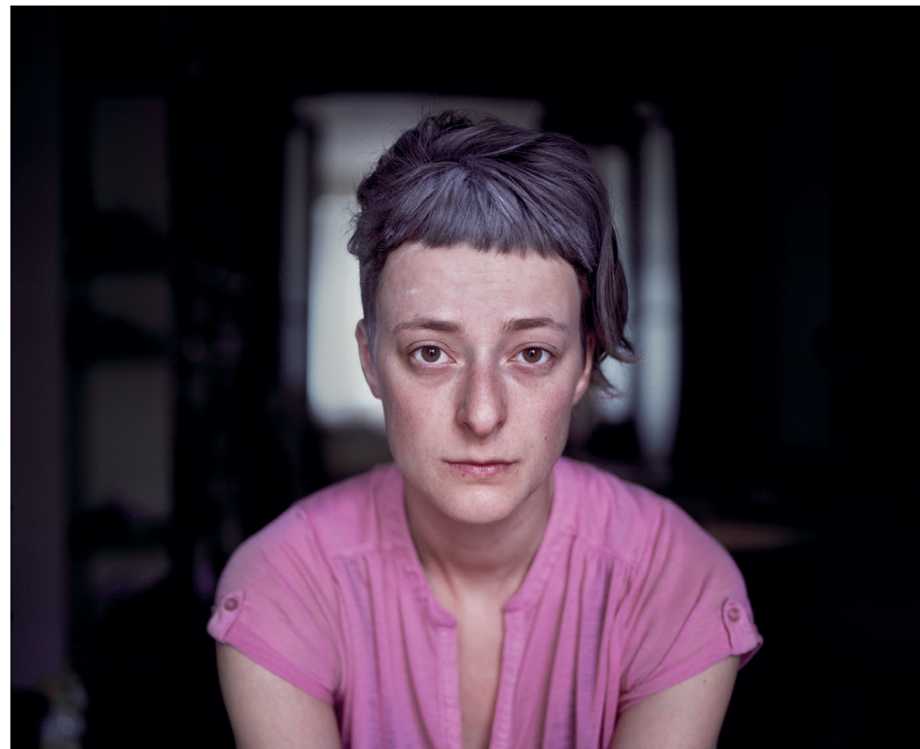
Would you be so kind as ..., részlet a sorozatból (2013–16)

A Vegyes házasságok (2015) videóinstallációja az Isztambuli Magyar Intézet pályázatára készült. Az alkotó mini interjúkat készített a kiválasztott török-magyar családok férfi és nőtagjaival, gyerekekkel, melyekben a kulturális különbségekre, közös nyelvhasználatra, illetve a család összetartó erejére kérdezett rá. A háromcsatornás videóinstallációban a három nyelven (angolul, magyarul, törökül) folyó társalgást ütköztette, s új közösségeket hozott létre a szereplők tudta nélkül.