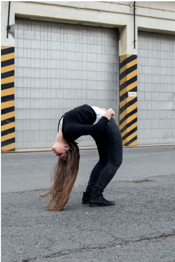
Would you be so kind as ..., részlet a sorozatból ( 2013–16)