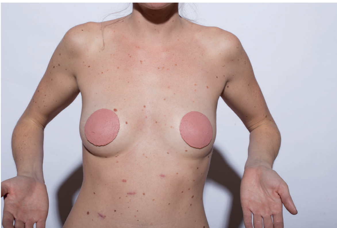
Would you be so kind as ..., részlet a sorozatból ( 2013–16)