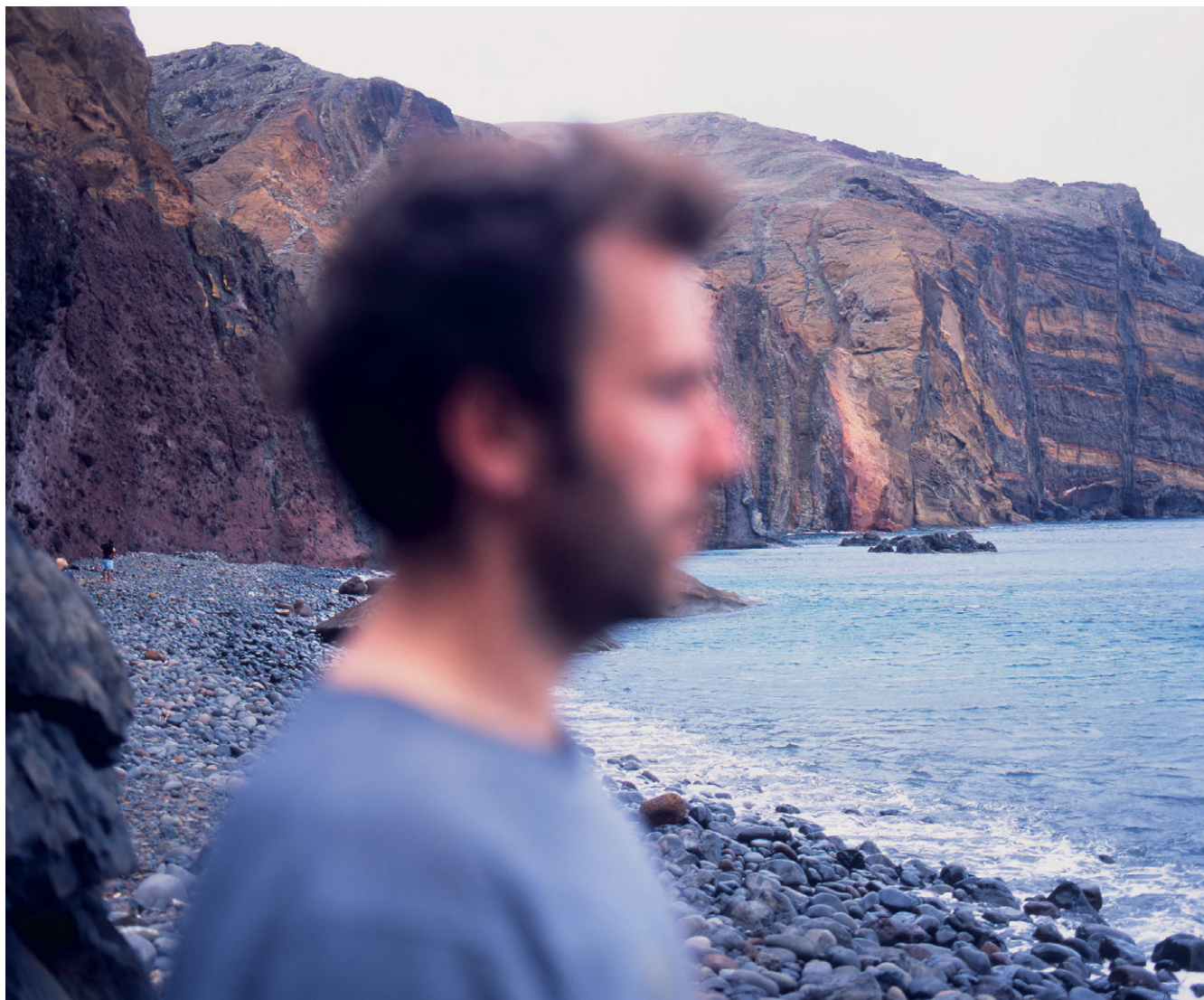
Would you be so kind as ..., részlet a sorozatból ( 2013–16)

a felnőtté válás, párkapcsolati helyzetek, tárgyak véletlen vagy tudatos egymásra találásának kompozícióit. Önarcképek, intim pillanatok, tájképek azonos hangsúllyal és jelentőséggel hol tabukat döntögető, hol banálisnak tűnő életképei jelennek meg, transzcendens áthallással vagy abszurd humorral tálalt szituációk külföldi utazásokról, otthonlétről, egy szöveges kommentek nélküli képfolyamban, ugyanakkor a laza szerkezet és a naplószerűség által mégis kirajzolódik egyfajta narra-