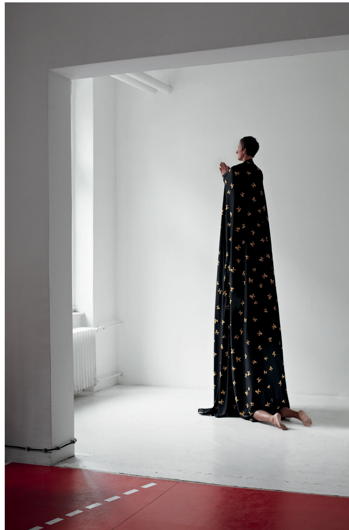
Would you be so kind as ..., részlet a sorozatból ( 2013–16)