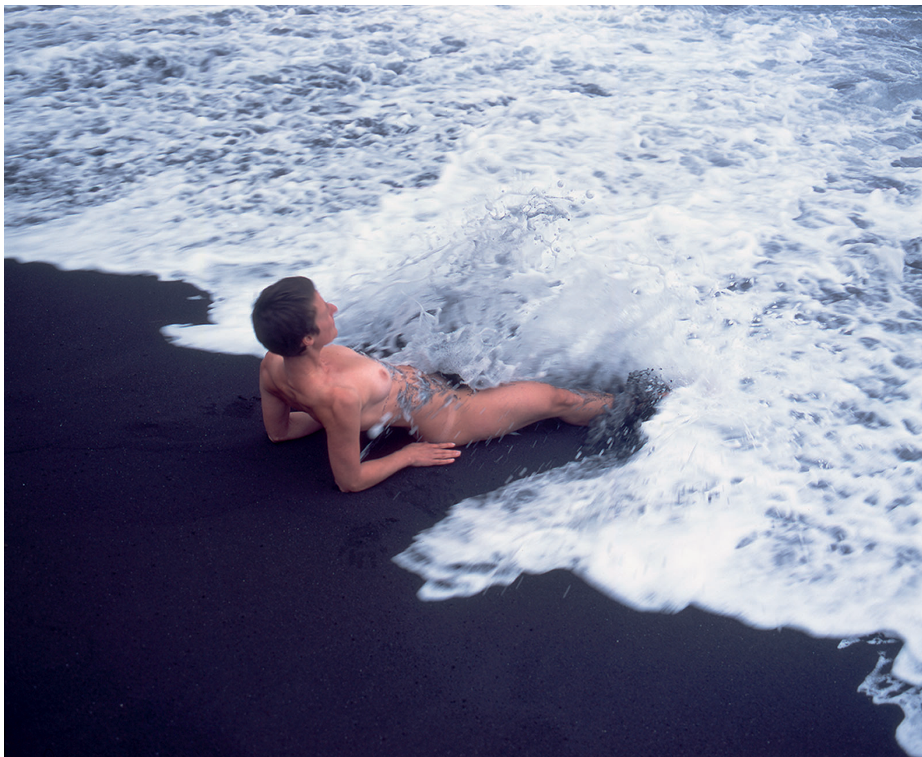
Would you be so kind as ..., részlet a sorozatból ( 2013-16)