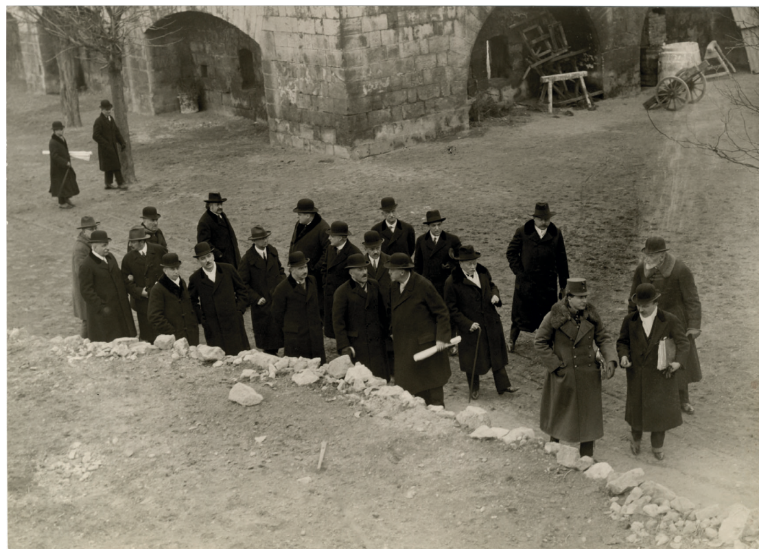
2014.50.4. ME.I.B. A Budapest Fürdőváros Egyesület által kiküldött bizottság József Ferenc főherceg vezetésével terepszemlét tart a gellérthegyi Citadellában, 1927. Hátoldalon lila gumibélyegző, szövege: „ ” 17x23,7 cm. A kép megjelent: Tolnai Világlapja XXIX. évf. 10. sz. 1927. március 2. 2. old. (hibásan írva:)