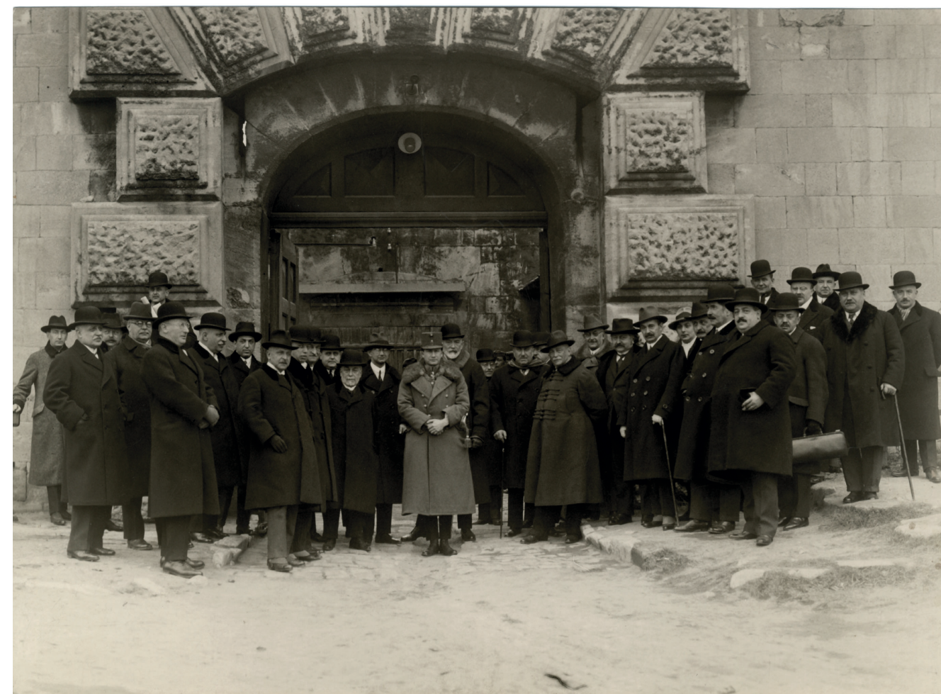
2014.50.5. ME.I.B. A Budapest Fürdőváros Egyesület által kiküldött bizottság József Ferenc főherceg vezetésével terepszemlét tart a gellérthegyi Citadellában, csoportkép a Citadella bejárata előtt, 1927. Hátoldalon lila gumibélyegző, szövege: „Copyright by Munkácsi Márton Budapest, VIII., József-körut 34.” 17,2x23,6 cm