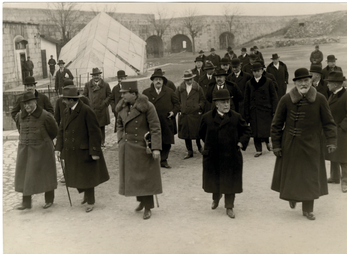
2014.50.3. ME.I.B. A Budapest Fürdőváros Egyesület által kiküldött bizottság József Ferenc főherceg vezetésével terepszemlét tart a gellérthegyi Citadellában, elől középen József Ferenc főherceg, a kép balszélén Bárczy István, 1927. A hátoldalon lila gumibélyegző, szövege: 17,2x23 cm