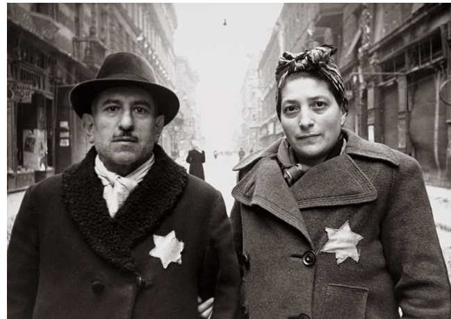
3. kép. Csillagos pár. Budapest, 1945. január. Jevgenyij Halgyej felvétele. Forrás: Magyar Nemzeti Múzeum Történelmi Fényképtár, ltsz: 83.542

A valós helyszín megállapítása érdekében indított kollektív nyomozás menetét és végeredményét a Budapest című folyóirat tette közzé. 17 A felfedezés nem keltett különös visszhangot, s a kép azóta is változatlanul „budapesti gettó” helyszínnel jelenik meg csaknem mindenütt. A Múlt-kor című történelmi magazin 2014. tavaszi számában is ezzel a képaláírással láttuk viszont, ám