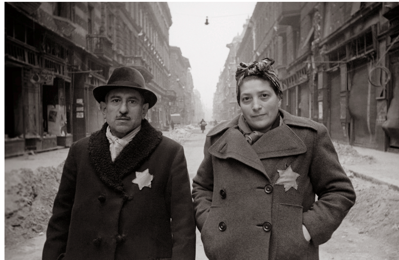
2. kép. Csillagos pár a Ráday utcában. Budapest, 1945. január.

Az alábbiakban a magyarországi holokauszt-fotográfiai archiválásában és publikálásában előforduló anomáliákra hozunk fel néhány jellemző példát. A hibák természetesen nem azonos súlyúak, miként a példaként bemutatott fényképek sem: vannak köztük világhírű fotográfusok emblematikus képei és ismeretlenek felvételei. Említünk olyan példákat, amikor a hibák kis körültekintéssel, némi szakmai ismerettel könnyedén elkerülhetőek lettek volna és olyanokat is, amelyeknél a kép valóságos adatai és az ábrázolt történések csak alapos, aprólékos kutatómunkával, többféle forrás felhasználásával deríthetők fel, s esetenként még így sem, ezért olykor csupán a felmerülő kételyek, kérdések, feltevések megfogalmazásáig jutunk el. A példák sora felfogható a jobbítás szándékával összeállított, válogatott hibajegyzéknek, s egyben figyelemfelkeltésnek arra a már közhelyszámba menő, de mégis gyakran elhanyagolt, alapvető követelményre,