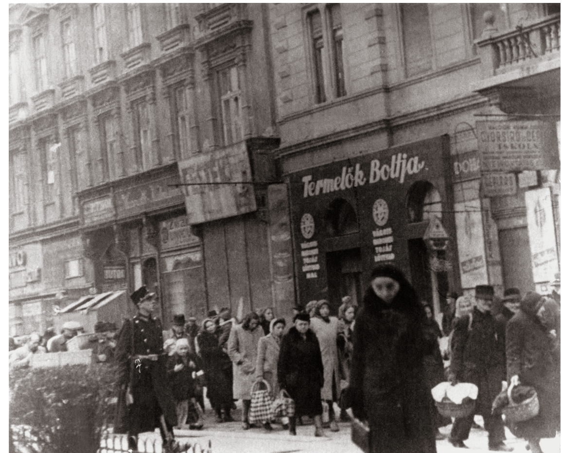
5. kép. Rendőr-kisérettel vonuló zsidók a József körúton az erzsébetvárosi gettó felé. 1944. november 28. Veres Tamás felvétele. Reprodukció: Raul Wallenberg. Swedish Institut, 1988. 42. o.