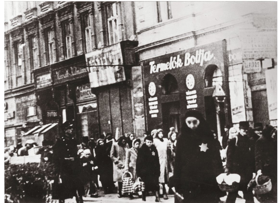
4. kép. Rendőr-kisérettel vonuló zsidók a József körúton az erzsébetvárosi gettó felé. 1944. november 28. Retusált változat. ltsz. 65.585

A pesti utcán szatyrokat, kosarakat, hátizsákot cipelő, rendőr kísérettel vonuló csoport fotója egyike annak az öt felvételnél, amelyet Veres Tamás 1944. november 28-án készített. (4–5. kép) A kép már 1947–1948-ban is többször megjelent nyomtatásban, Lévai Jenő újságírónak köszönhetően, aki a kópiához – Veres