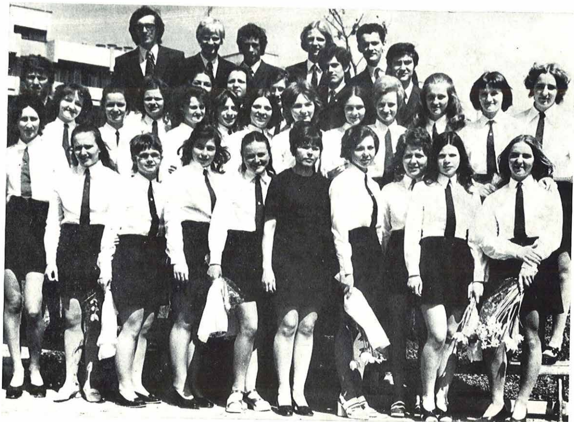
IV. c. osztály