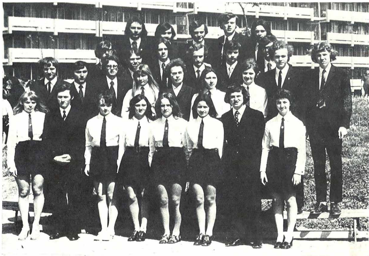
IV. a. osztály