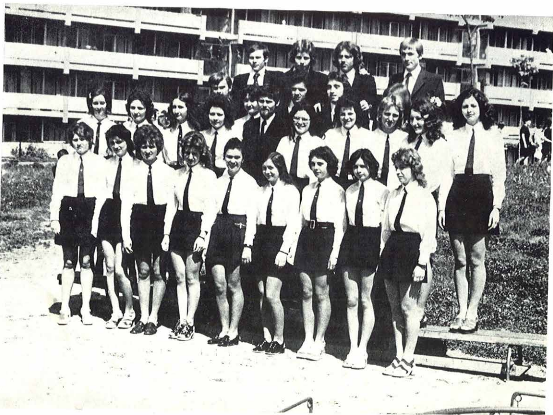
IV. d. osztály