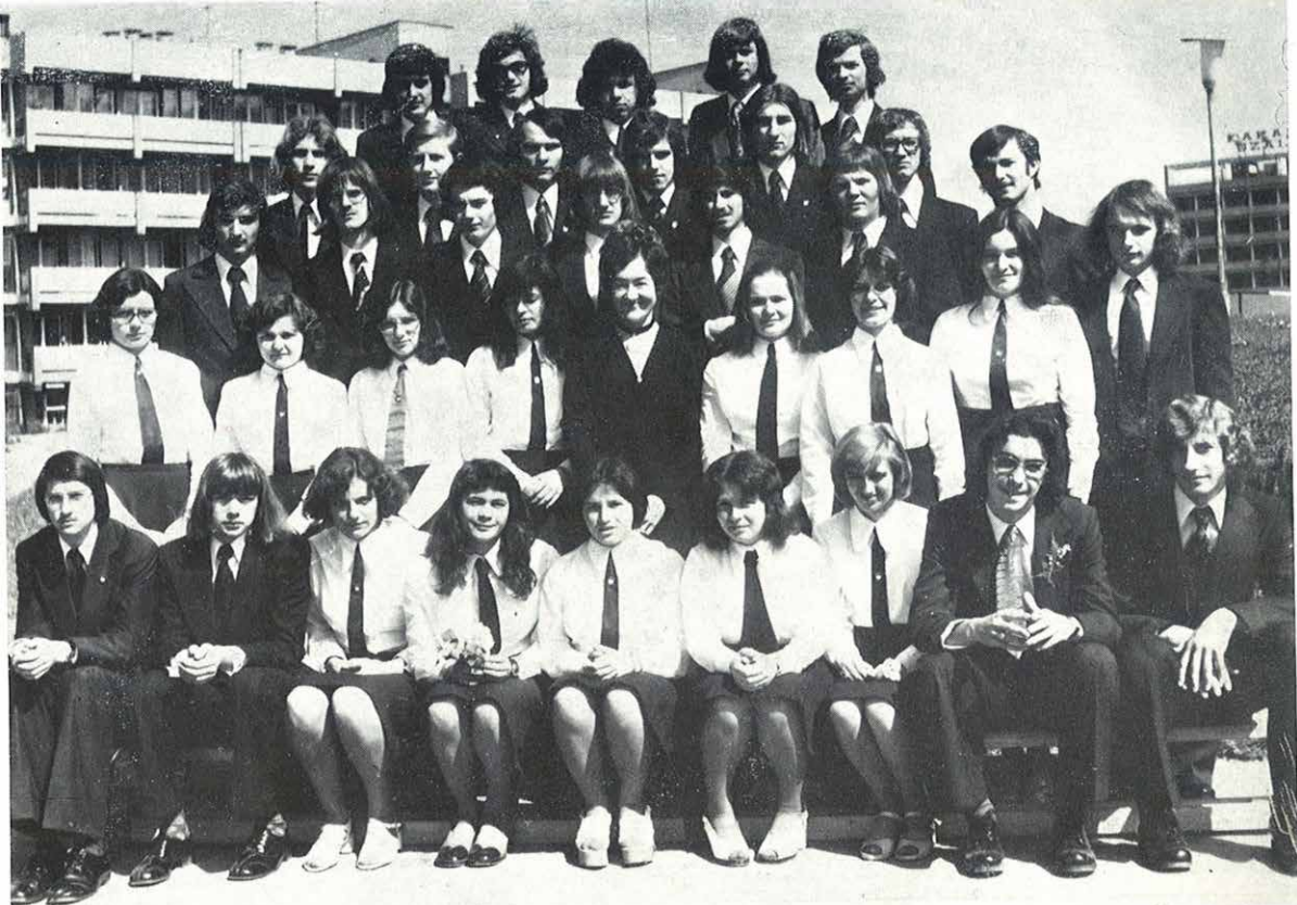
IV. a. osztály