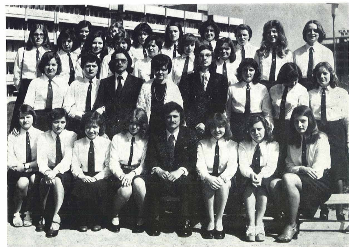
IV. b. osztály