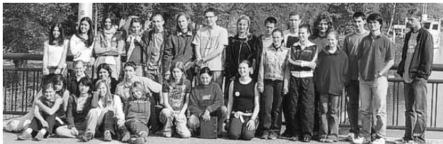
Csoportkép a hídon