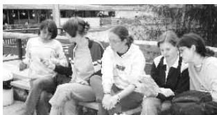
Barlangtúra után - tanösvény előtt