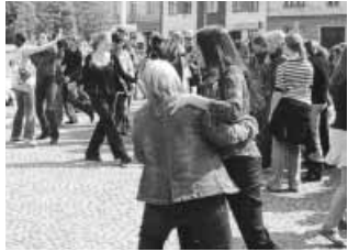
Bolondozás a téren a fesztivál zárónapján