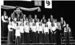
Színpadon a Bolyai Kamarakórusa