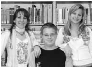
Alt Petronella 11. d