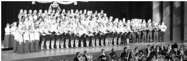
A városi konferenciatermék színpadára minden résztvevő kórus felírt