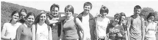
Kis csapatunk...