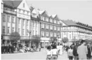
Hradec Kralove házai mintha mézeskalácsból lennének

A három nap alatt összesen 4 koncerten énekelünk. Ezek között akadt templomi, szabadtéri, nagy