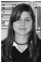
Kiss Edina 11. b

2006. május 19. zuhogott az eső... amint leszálltunk a buszról, és a távolsági buszmegálló felé vettük az irányt, nem tudtuk eldönteni, hogy a csomagjainkat fogniuk erősebben vagy pedig az esernyőt. Na, szép kis kirándulás lesz! Még el sem indultunk, és nem elég, hogy az idő sem kedvező, de még a cipőink is eláztak. Mikor hatalmas pocsolóvák kikerülése, átugrása (rosszabb esetben beleugrása) árán végre eljutottunk a