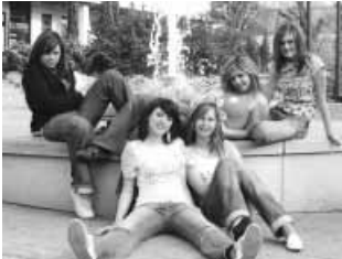
Az öt grácia