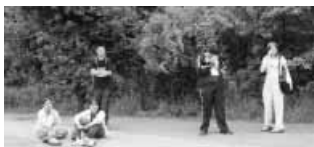
Fáradtan... elhagyatva... reménytelenül... itt már végképpen elfogyott a sárgajelzés