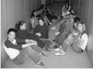
Kupaktanács a kollégiumi folyosón