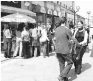
A város utcáin sétálva egyeseknek fagyvizni, másoknak táncolni támadt kedvük

Vasárnap, az utolsó napon egy vidám szabadtéri koncerttel zárult a fesztivál. A jó hangulathoz egy fűvöszenekar szereplése is hozzájárult. A felszabadult salgótarjáni ifjúság bolondos táncba kezdett a csehek egyik kedvelt indulójára, aminek dallamát itthon a Sej Haj Rozi című nótából ismerjük.