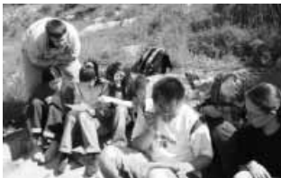
Tudáspróba a természetben