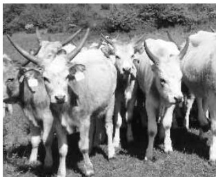
Ezek nem mi vagyunk...