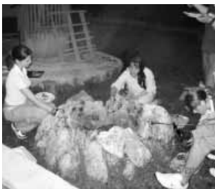
A szombati estebédet mindenki magának készítette...