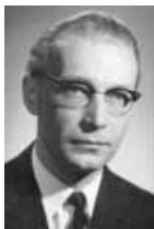
Fabulya László Bolyai Emlékérem