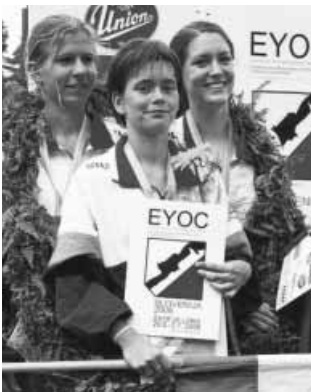
Ifjúsági Európa Bajnokság, csapat 2. helyezés

Végül eljött a várt esemény. A sulinak és az év végéi vizsgáknak, feleléseknek már vége volt, amiket nem volt könnyű végigcsinálni a mindennapos edzések mellett. Kipihentem a sulis fáradalmait, és már csak a versenyre tudtam gondolni. Az EB 3 versenyszámból áll: sprint, normál és váltó. Magamat ismerve a sprint versenyen vártam jobb eredményt. De sajnos a pálya közben pillanatnyi koncentráció kiesés miatt nem sikerült olyan helyezést elérni, hogy elégedett lehessenek magammal. Bár fizikailag nagyon jó formában voltam, nem ezen múlott, hanem hogy mennyire tudok végig magas pulzusszám mellett odakonzentrálni csak arra is, ami a pillanatnyi feladatod a verseny során. Kissé