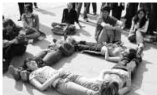
A harmadik nap végére mindenki fáradt, jól esik a pihenés – természetesen együtt

hangversenytermi, így a legkülönfélébb helyszíneken próbálhattuk ki kis kórusunk hangzását. Különösen nagy élményt jelentett számunkra a városi konferenciaközpontban való éneklés. Azt hiszem, ekkora színpadon és ilyen sok ember előtt még egyik kórustag sem szerepelt. Elhangzott néhány olyan mű is, amelyet minden résztvevő kórus megtanult, így együtt énekelhetett több száz ifjú a városi szimfonikus zenekar közreműködésével.