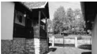
A szállásunk Aggteleken – vidéki idill...