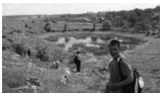
Bálint már tudja, hogy az Aggteleki-tó egy víznyelő eltömődésével keletkezett...