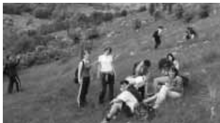
... és megpihentünk az ördögszántáson