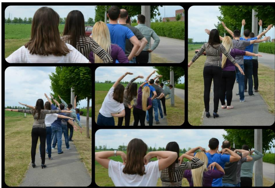
Forrás: „Egészségedre! Mókuserék helyett” facebook oldal