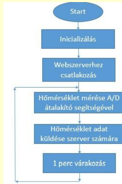
4. ábra Hőmérsékletmérő és adattovábbító alkalmazás működésének folyamatábrája