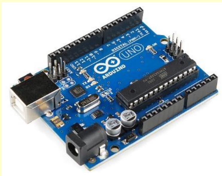
1. ábra Arduino UNO R3

A hőmérsékletmérés megvalósításához egy Arduino UNO (1. ábra) alapú beágyazott rendszer került felhasználásra, mely az oktatás szempontjából számos praktikus előnyt jelent. Az Arduino nem más, mint egy fejlesztőplatform, melynek rengeteg különböző változata ismert. A kisebb teljesítményű Arduino NANO-tól egészen az egész nagy programokat is kezelő és lefuttató, ARM architektúrára épülő Arduino Leonardo-ig. Ez főként hardver teljesítményben mutatkozik meg, hiszen a Leonardo körülbelül 16-szor nagyobb teljesítményű, mint az UNO. A projektben egy Arduino UNO került alkalmazásra, amely 32kB kód memóriával, 2kB RAM-mal, 13 digitális Be/Ki-meneti és 6 analóg bemenettel rendelkezik. Számos különböző feladat elvégzésére alkalmas ez a fejlesztőmodul, kezdve a motorok meghajtását, a szenzorok, kiegészítők működtetéséig és az interneten számos kidolgozott projekt érhető el, mely az oktatásban, a projektfeladat kidolgozása során egyes problémák megoldásában nagy segítséget nyújthat a hallgatóknak. Az Arduino UNO a számítógéphez egy USB-n keresztül kapcsolódik, amely lehetővé teszi a gyors programkód feltöltést és kommunikációt egyaránt, mely a programkód helyes futásának ellenőrzésére is jól felhasználható (Sziládi, Ujbányi, Katona, 2016).