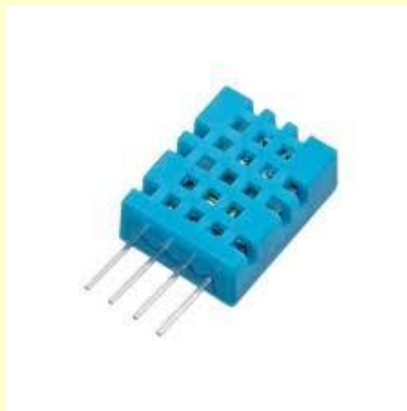
6. ábra DHT11 páratartalom és hőmérséklet érzékelő

A páratartalom- és hőmérsékletmérés egy DHT11 alacsony költségű digitális hőmérséklet- és páratartalom-érzékelő segítségével került megvalósításra (6. ábra). Ennek az az előnye az LM35 hőmérsékletérzékelővel szemben, hogy a hallgatók az analóg kimeneti jelű érzékelőkön, jelátalakítókön kívül egy digitális kimenetű, programozott módon kiolvasható érzékelő gyakorlati alkalmazását is megismerhetik. Az egység kapacitív páratartalom-érzékelőt és termisztort használ a környező levegő páratartalmának és hőmérsékletének mérésére, a mért adatokat digitalizálja és így olvasható ki az egységből. Az érzékelő 2 másodpercenként szolgáltat új mérési adatokat.