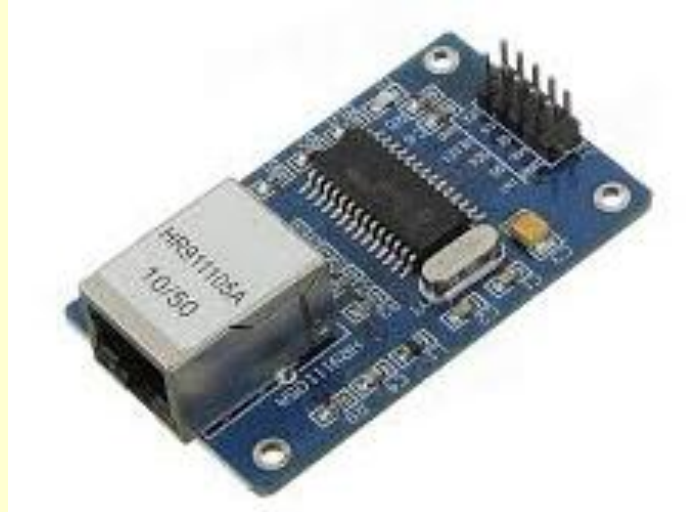
3. ábra Ethernet modul