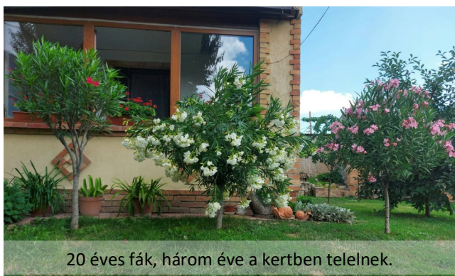
20 éves fák, három éve a kertben telelnek.

A neten már többször megcsodáltam Ibolya kertjét, mely minden évszakban kellemes, megnyugta-