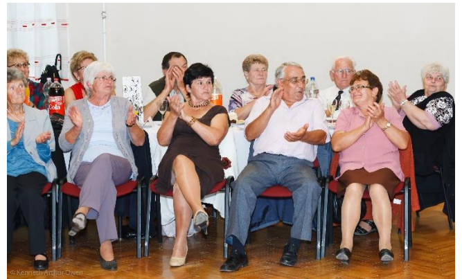
A fellépő művész mosolyt csalt az arcokra