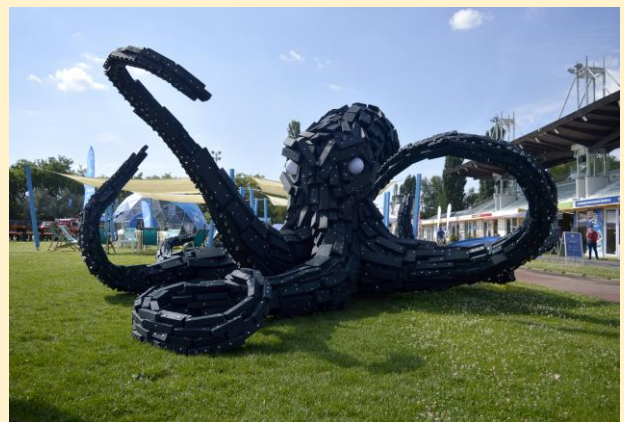
A vízilabda sportág jelképe a polip