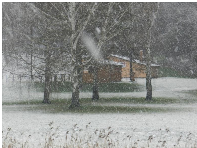
2014. január 24.