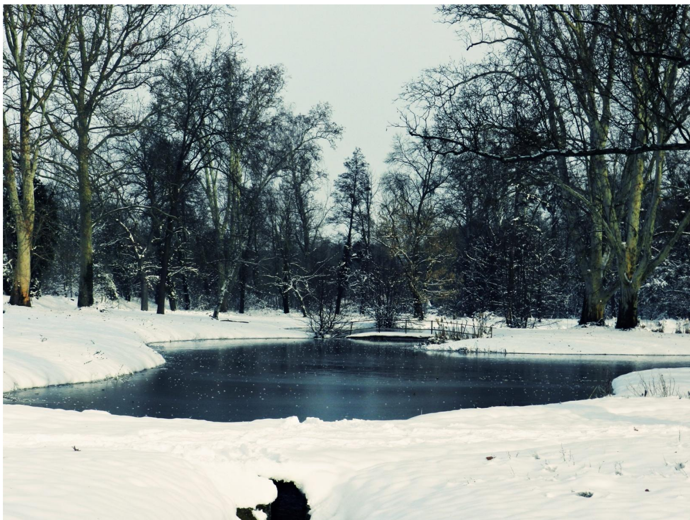
2014. január 27.