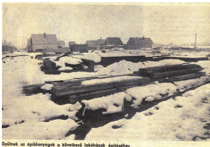
Gyűlnek az építőanyagok a következő lakóházak építéséhez

1984. Február 3. Magáneros lakás- építés Szigetvárot és a körzet közsé- geiben" címmel cikket közölt a Dunántúli Napló s tájékoztat, hogy Mozsgón 47 telket biztosítanak la- kásépítésre.