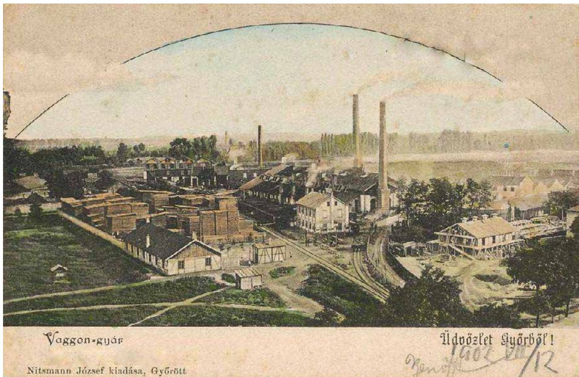
A Vagongyár látképe egy 1902-ben postázott képeslapon. A Magyar Vaggon- és Gépgyár r.-t. 1896. december 28-án alapították – 2 millió koronátókével és 1000 emberrel kezdte meg működését 1897-ben.