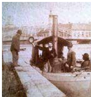
Borító 1 (címlap): 1895 áprilisában Feszty Árpád, a Magyarok bejövetele ihletett lelkű teremtőjének hajója, a DÉVÉR kiköt a győri Sétatér-szigeten, a Városi Színháznál.