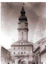
Borító 2 (hátlap): A Fehérvári kapu fényképe bontás előtt. 1895-ben lebontották, a torony az épülő új városházában éledt újjá.