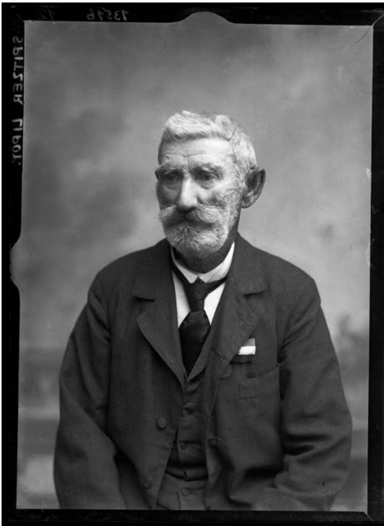
Spitzer Lipót (1827–1909) házaló