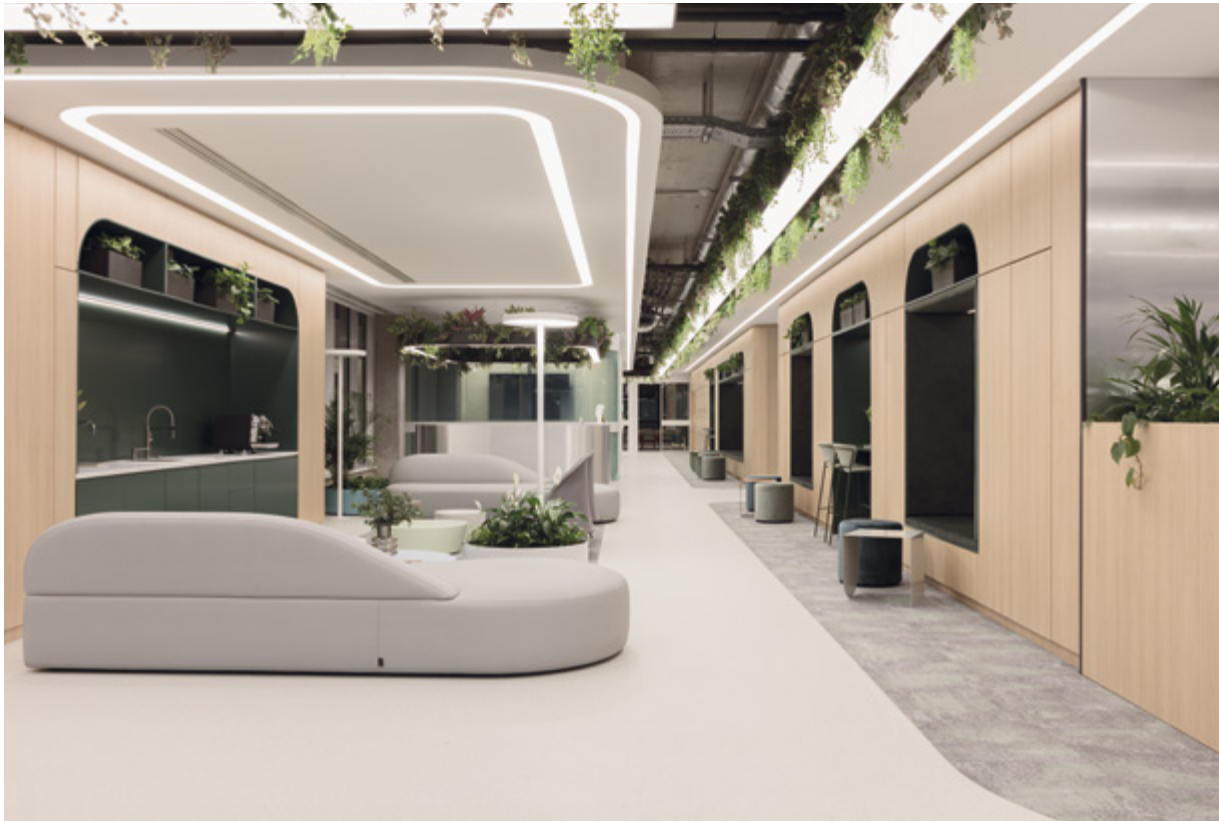
^ A térben futurisztikusság és a skandináv design természetes letisztultsága elegyedik