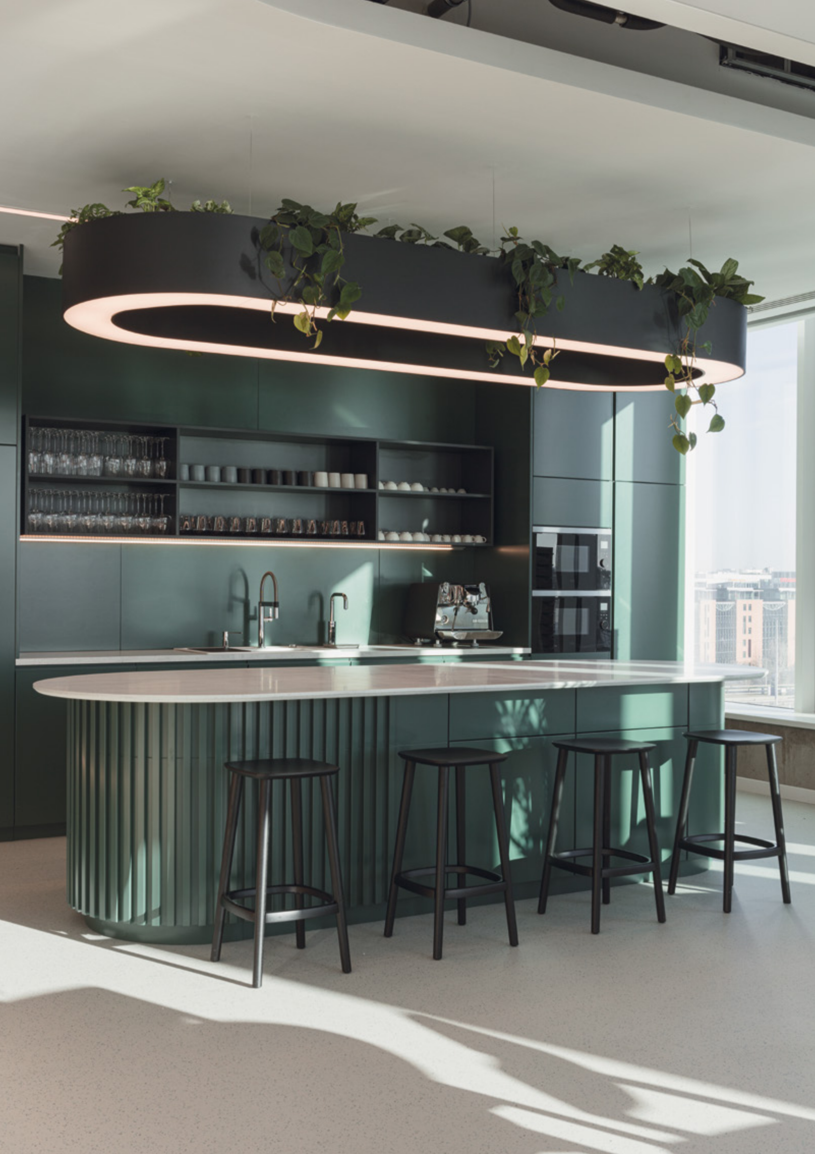
Építész tervező: FARKAS ANETT – ARCH STUDIO KFT. Szerző: ZSOLDOS ANNA