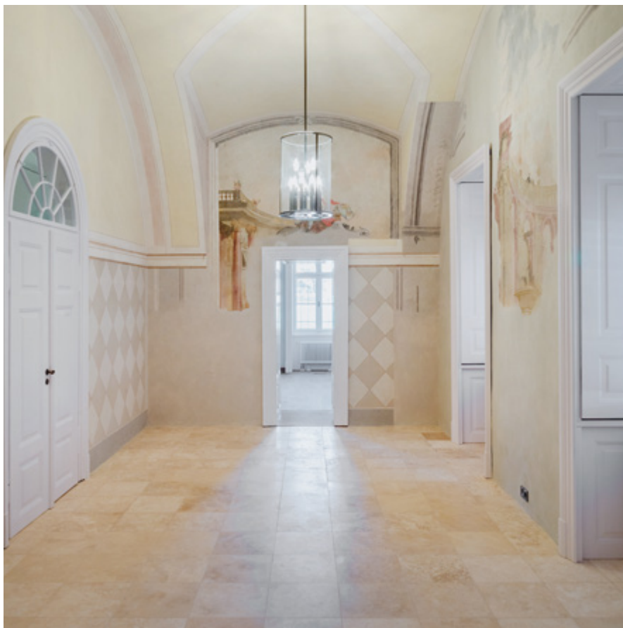
A földszinti térsoron található kápolna a bejárata felől, oldalfalán a feltárt falképzészetekkel