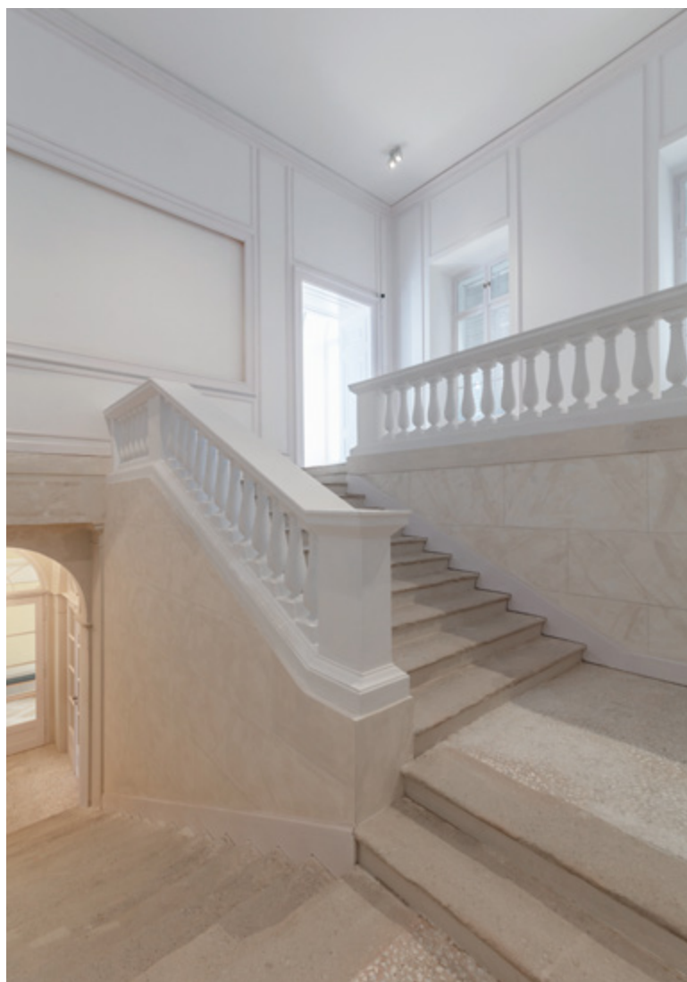
> A kastély főlépcsőháza: állítólag az Ördöglovas lova hátán gyakran lépcsőzött fel az emeletre, ennek az „emléknek” őrzői a csipkézett lépcsőfokok