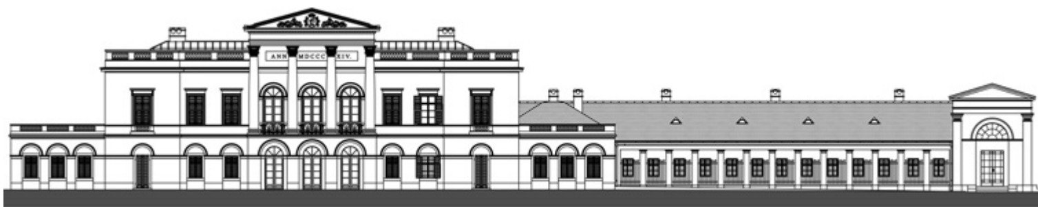
A kastély délnyugati oldali (kerti) homlokzati rajza és az alaprajz a földszinti terek jelölésével

ben zajló nagyszabású helyreállítás pedig 2018-ben indult el.