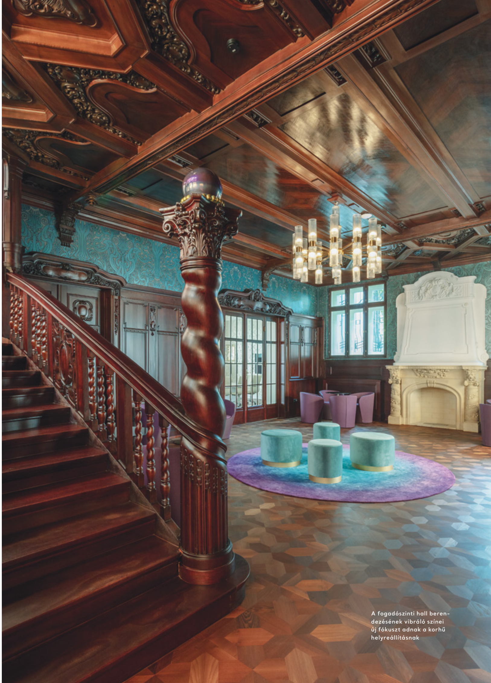
A fogadószínti hall berendezésének vibráló színei új fókuszot adnak a korhű helyreállításnak