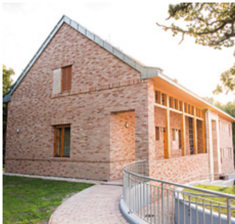
■ Svábhegyi Református Parókia