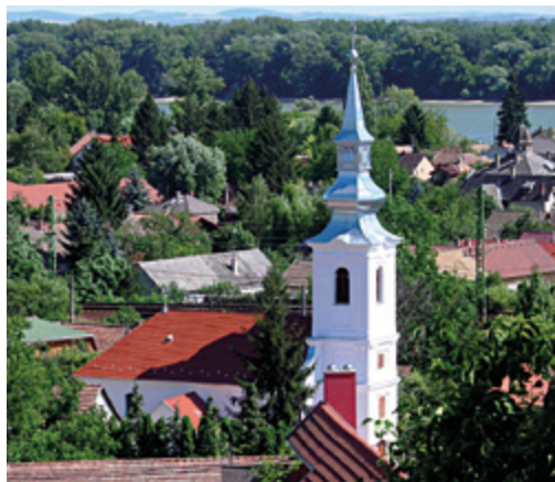
■ Verőce, Református templom