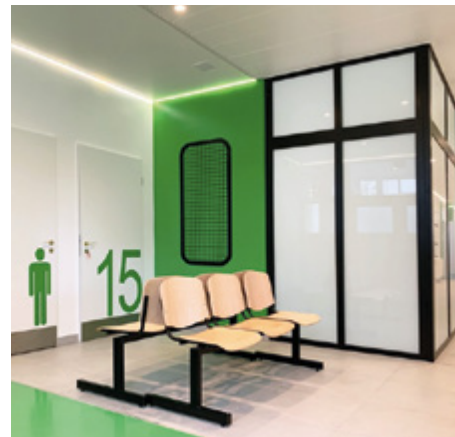
■ Csikó sétány Rendelőintézet