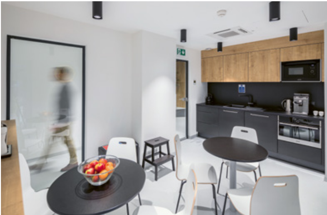
A közös terek – például a konyha – az elszeparált munkaállomások között kaptak helyet

A 2019-ben lezajlott átalakítás során az új tulajdonosnak és a tervezőirodának is egyaránt fontos volt a hely szellemének megőrzése.