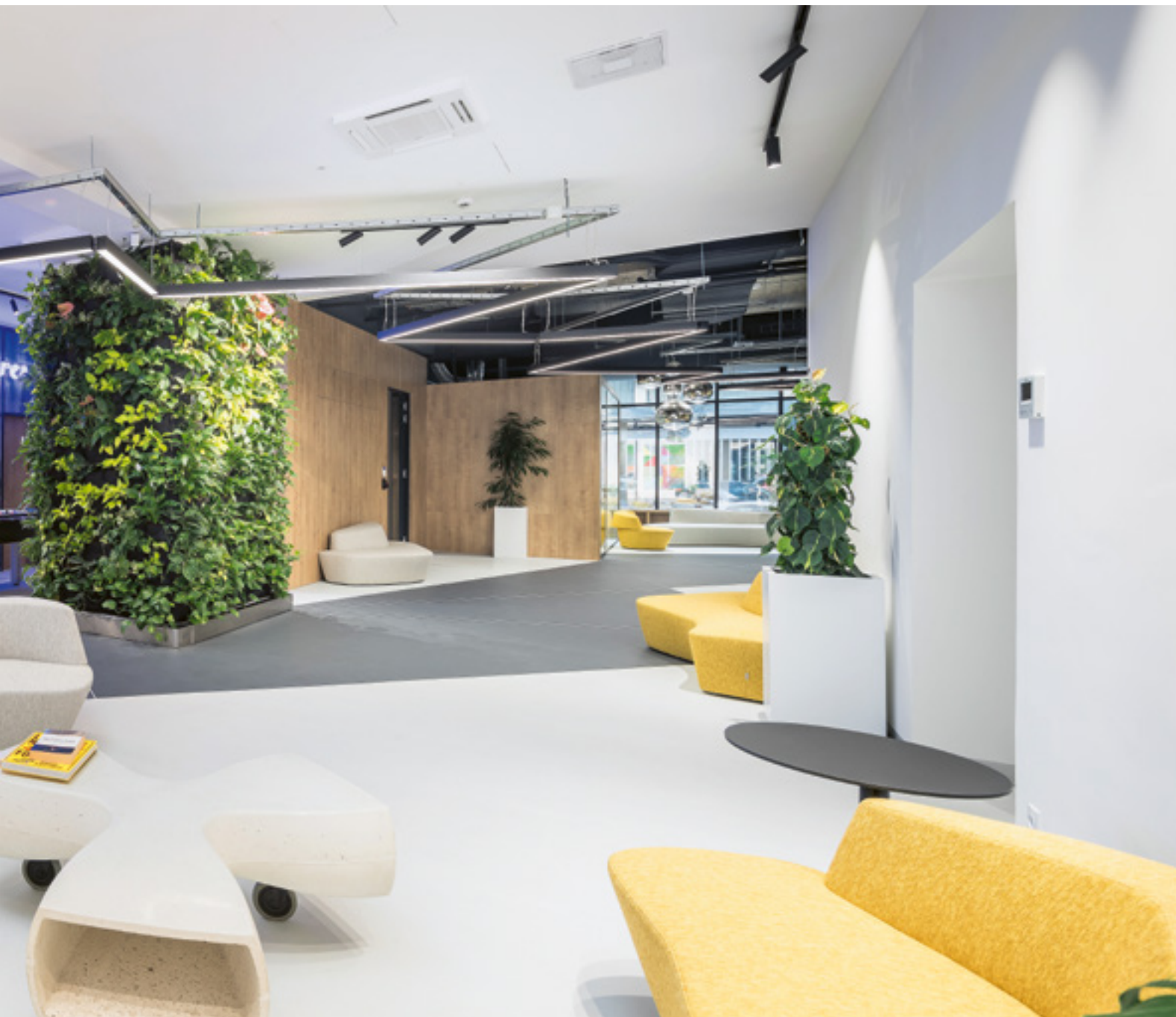
Szerző: SZŐNYEG-SZEGVÁRI ESZTER Építéset-belsőépítéset: HATVANI ÁDÁM – SPORAARCHITECTS ÉPÍTÉSZETI KFT.

A keleti blokk vasfüggönnyel keretezett játszóterének budapesti grundján a hatvanas-hetvenes években a vendéglátóipar sorra nyitotta meg kultikus helyszíneit.