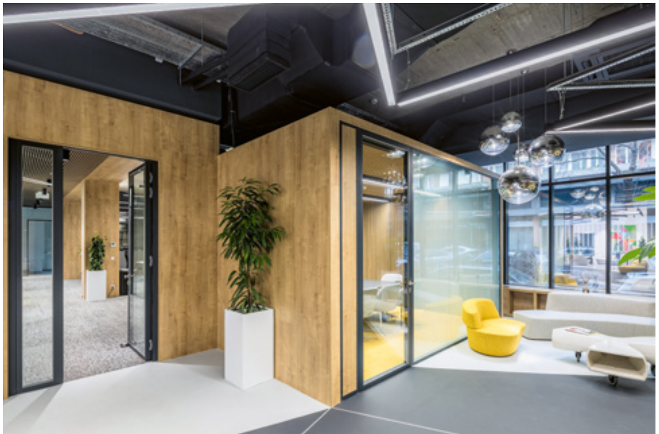
Háttérben a lounge hangulatú közösségi tér

A 2019-ben lezajlott átalakítás során az új tulajdonosnak és a tervezőirodának is egyaránt fontos volt a hely szellemének megőrzése.