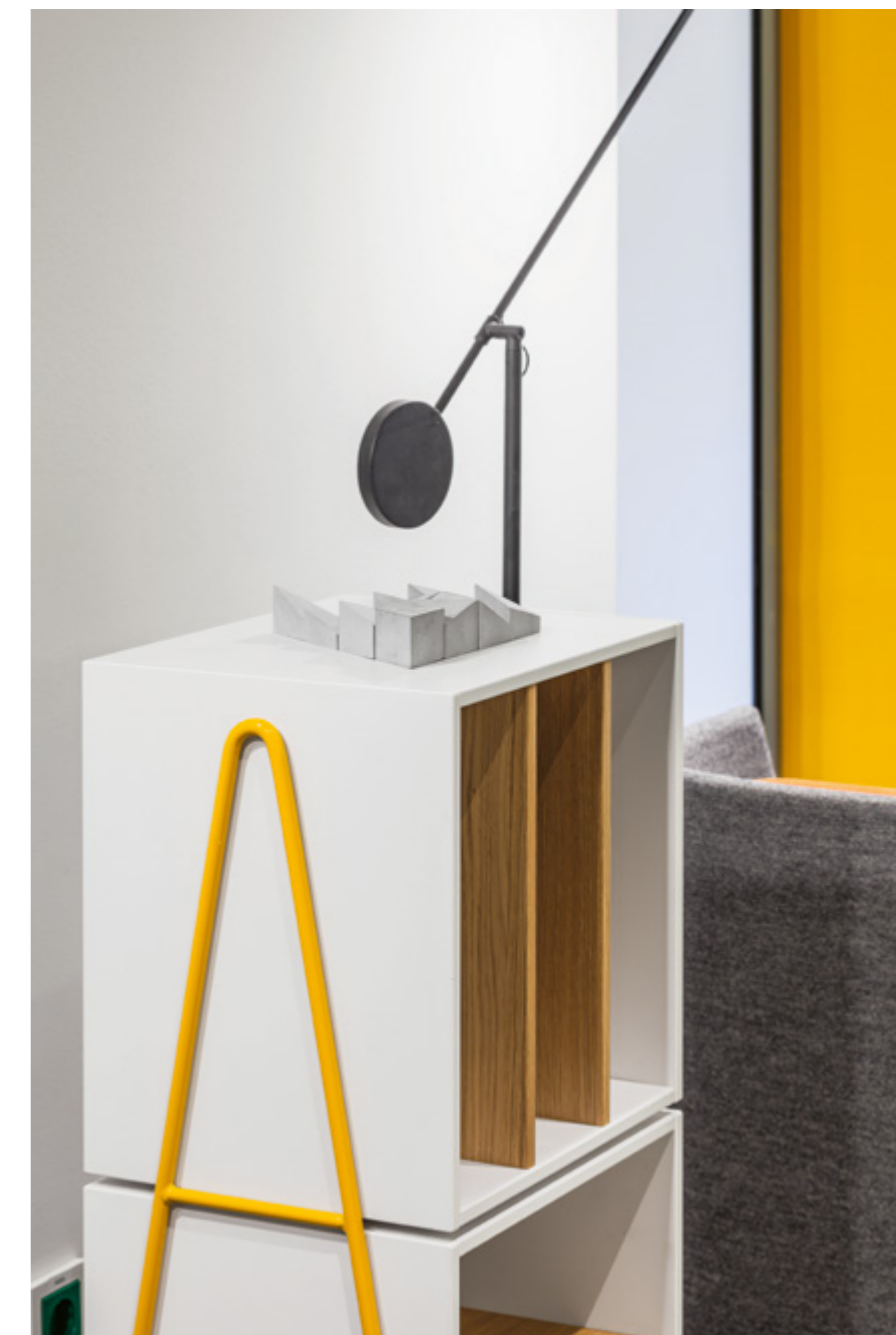
Szerző: VAKLI TÜNDE Tervező: MINUSPLUS GENERÁLTERVEZŐ KFT.

A 2018 februárjában elkészült első fázis után, idén nyáron átadták a WorldQuant kutatóközpontként funkcionáló irodájának újabb egységét a Szabadság téri neobarrók palotában. Akárcsak az első, a második ütem belsőépítészeti terveit is a Minusplus jegyzi, így az építészcsoport elképzelései alapján valósult meg a nemzetközi befektetési elemzéssel foglalkozó vállalat teljes munkaterülete. Az egy emelettel feljebb történt bővítés során további tárgyalókat, fókusz-szobákat, nyitott munkaállomásokat alakítottak ki. A designstratégia megfogalmazásakor kulcsfontosságú szempont volt a Minusplus számára, hogy a WorldQuant profilját meghatározó kétféle génre : a globális és a kvantitatív elemző jellegre reflektáljanak. Első körben a világgazdasági szerepre, multinacionalitásra