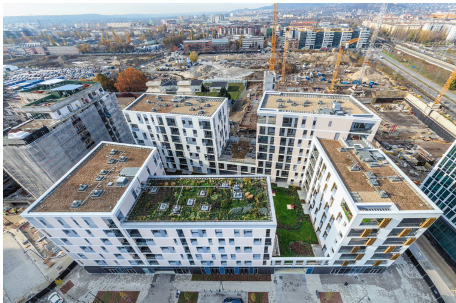
A már átadottakkal együtt 15 lakóház és 13 irodaház, kiskereskedelmi területek, hotel, óvodák, orvosi rendelők, sportpályák, játszóterek, közösségi kertek épülnek ki a Duna közelében

BRA szintterület (bruttó): 15 839 m 2 BRC szintterület (bruttó): 11 594 m 2 Tervezés éve: 2016-2017 Átadás éve: 2019