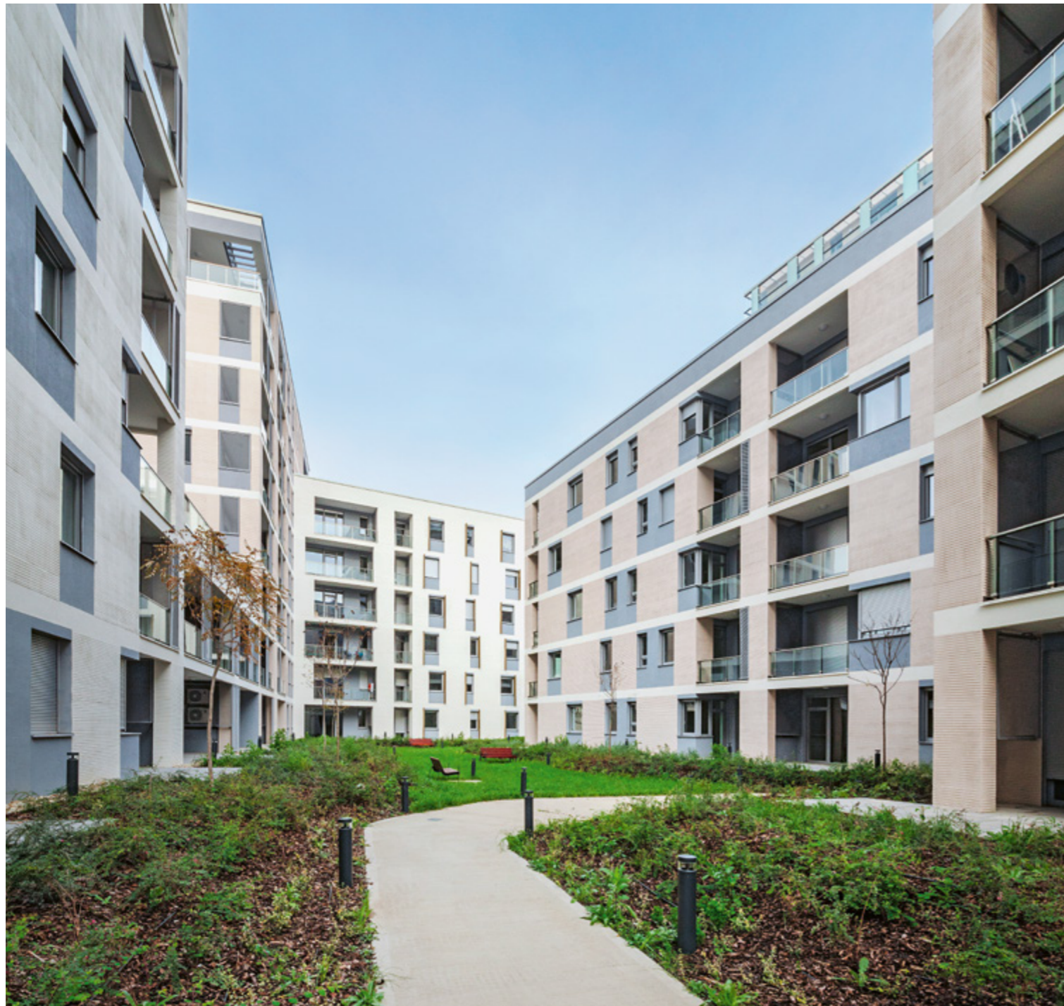
A lakóközösség saját használatú, belső kertje a BudaPart Otthonok 'A' épület tömbjei által közrefogva