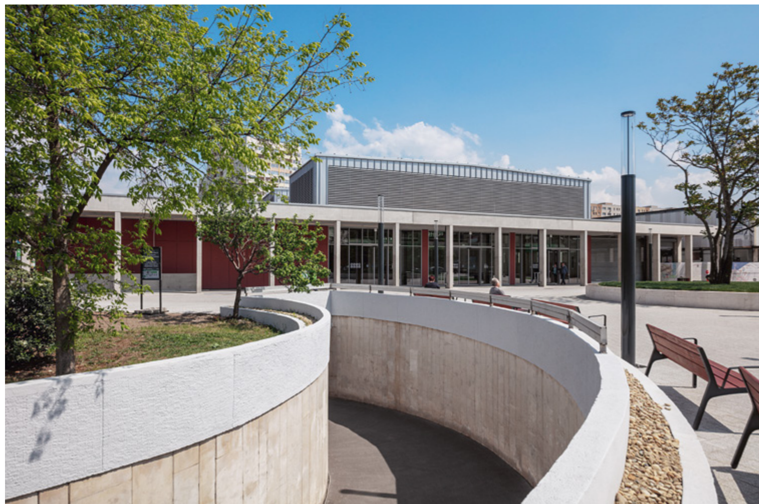
Az új alközpont a piac mellett a közösségi terekre épít

TÖBB ÉV MÉRLEGELÉS ÉS TERVEZÉS UTÁN, NEMRÉG KÉSZÜLT EL A III. KERÜLET JELENLEGI LEGNAGYOBB BERUHÁZÁSÁNAK, A BÉKÁSMEGYERI PIACNAK AZ ELSŐ ÜTEME. A MEGÚJULÓ KERESKEDELMELMI TEREK MELLETT KOMOLY SZEREP JUT A KÖZÖSSÉGI AGORA KIALAKÍTÁSÁNAK IS.