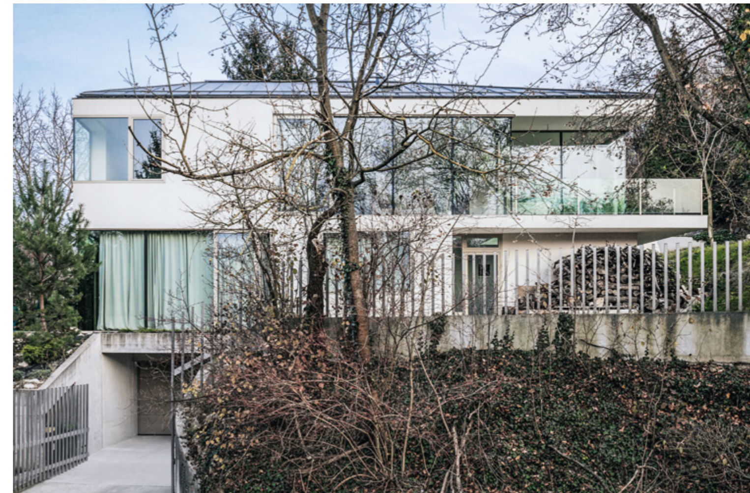
Három szint, három funkció