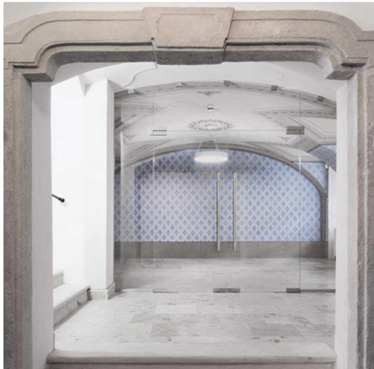
A 19-20. században épült válaszfalak kibontásával alakították ki a recepciót, melynek üvegfallal látni engedni a festett falakat.

világháborúig a barokkban gyökerező térstruktúra is szervesen fejlődött, megmaradt a helyiségek klasszikus sora. Ugyanakkor az építők bátran hozzányúltak ahhoz, ami az aktuális korban már túlhaladott igény maradványa volt. Kelcz József királyi személynök 1766-ban például kifejezetten azért vette meg a 14. századi városfal egy darabját, hogy egy részét lebontva építkezzen tovább a külső falgyűrűig – a városfal a később épített istállóban megmaradt, ma annak egyik hosszfalát alkotja. A kutatás a külső 16. századi városfalban az emeleti helyiségekben befalazott, elvakolt, szinte ép korabeli lőrészeket talált, valamint egy 1766-ból származó árnyékszék elfalazott szellőzőnyílását. A háború utáni korszak a homlokzatokon törekedett a műemléki értékek megőrzésére, belül azonban a kor igényeinek megfelelően szükségleteket alakítottak ki, melyek vizesblokkjai és belső válaszfalai tönkretették az eredeti térszerkezetet.