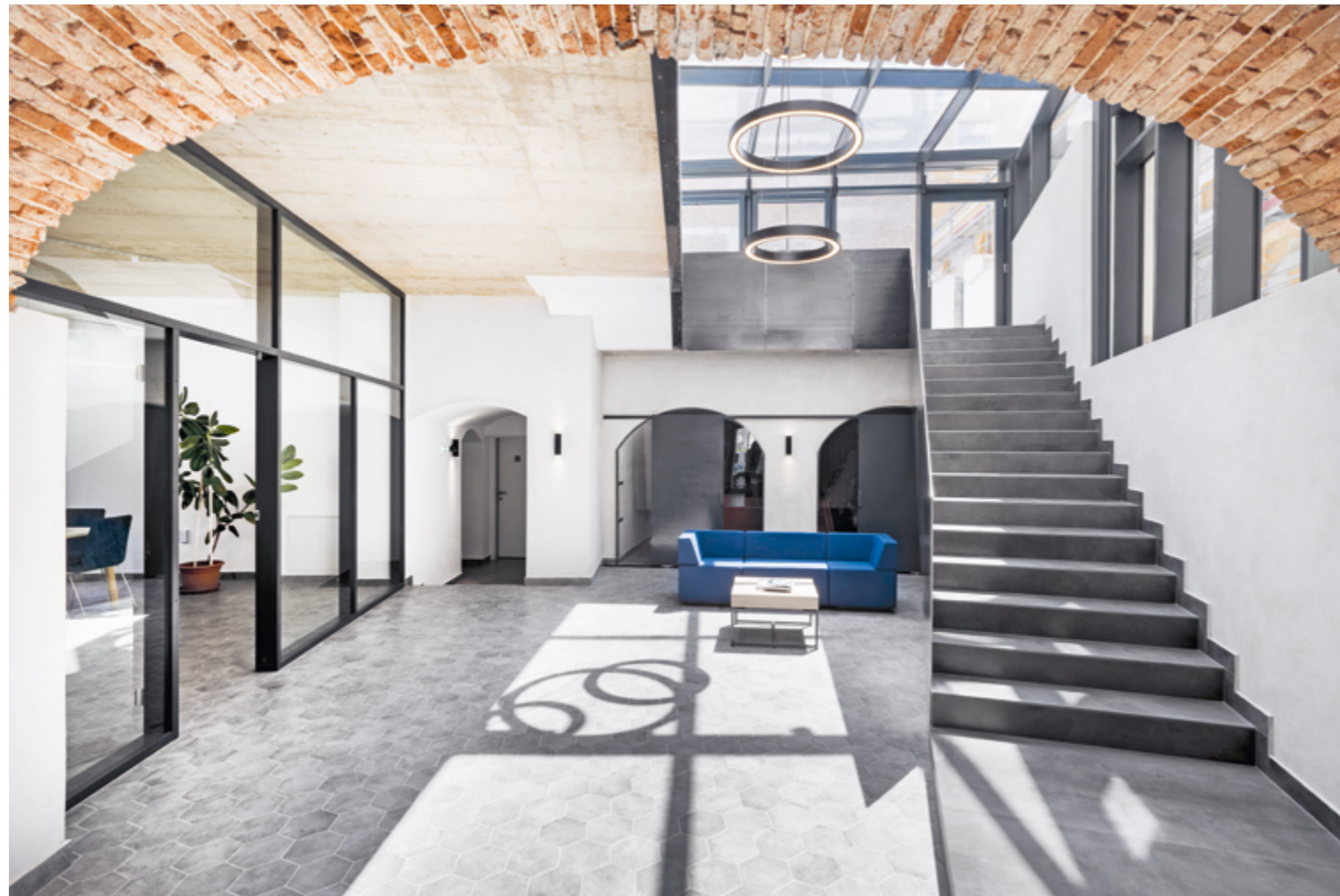
Az íves formák megjelenése lágyítja a szabálytalan szögek és ferdek uralta környezetet.