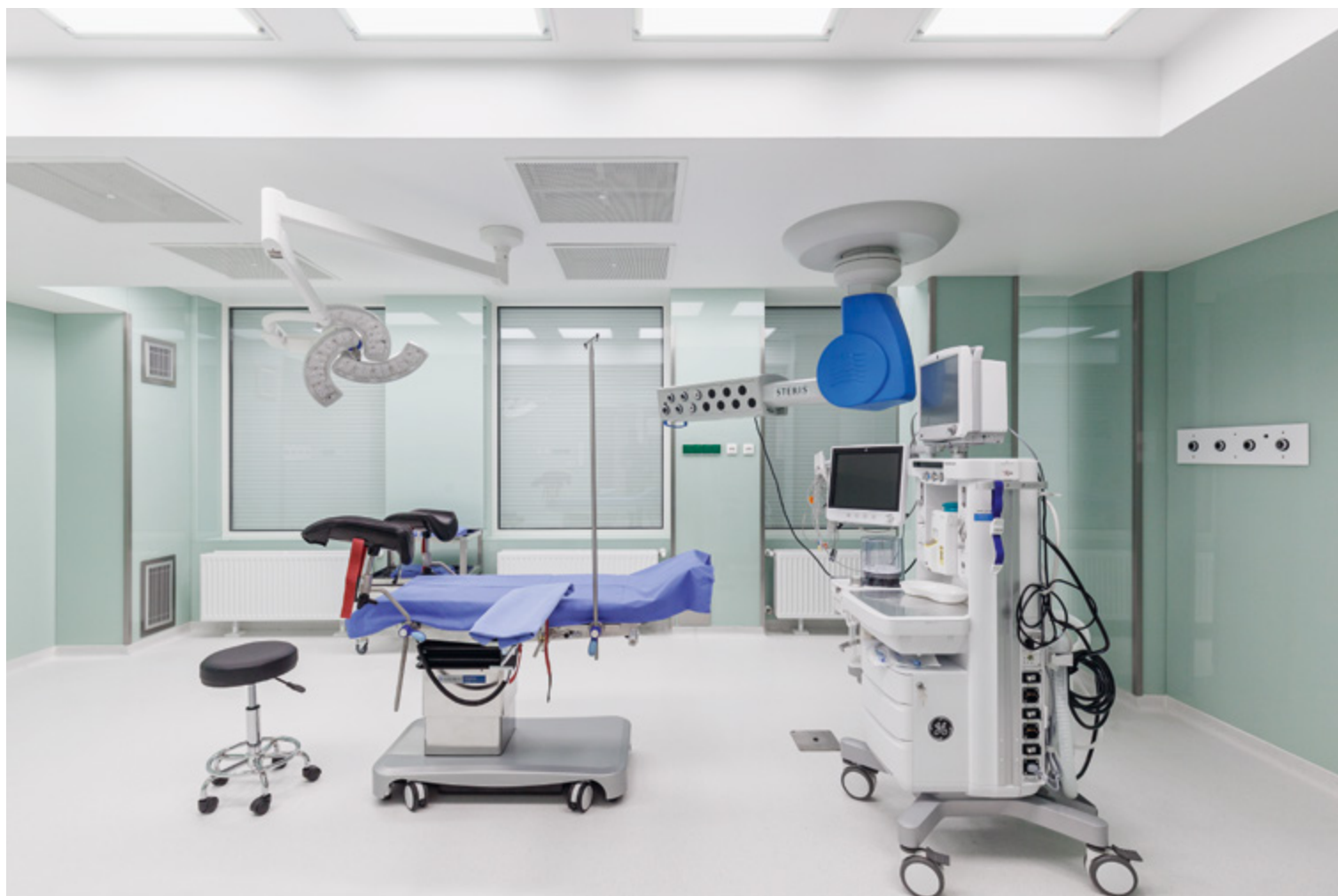
Vizsgáló (balra) és műtőhelyiség (jobbra).

a mosdóban minden kicsi, a nagytól a kicsi-ig való tervezés újabb értelmet nyert. A gyerek WC láttán az infantilis énem azonnal előjött. Meglepő és fontos: gyerekek számára ilyen kidolgozott és kedves mosdóval nem gyakran találkozunk egészségügyi intézményben. Visszagondolva az elején leírt mondatra, a Maternity mégsem csak nők számára készült. Aki itt férfiként együtt éli át a társával a szülői örömeiket, az valami mást is hazavisz innen. A nőiség a maga természetességében jelen van. Nem hivalkodóan, nagyon finoman, hitelesen, ezáltal sokkal erősebben. A férfi vendég itt nem kívülálló, hanem részese az érzésnek. (A szerző belsőépítész)