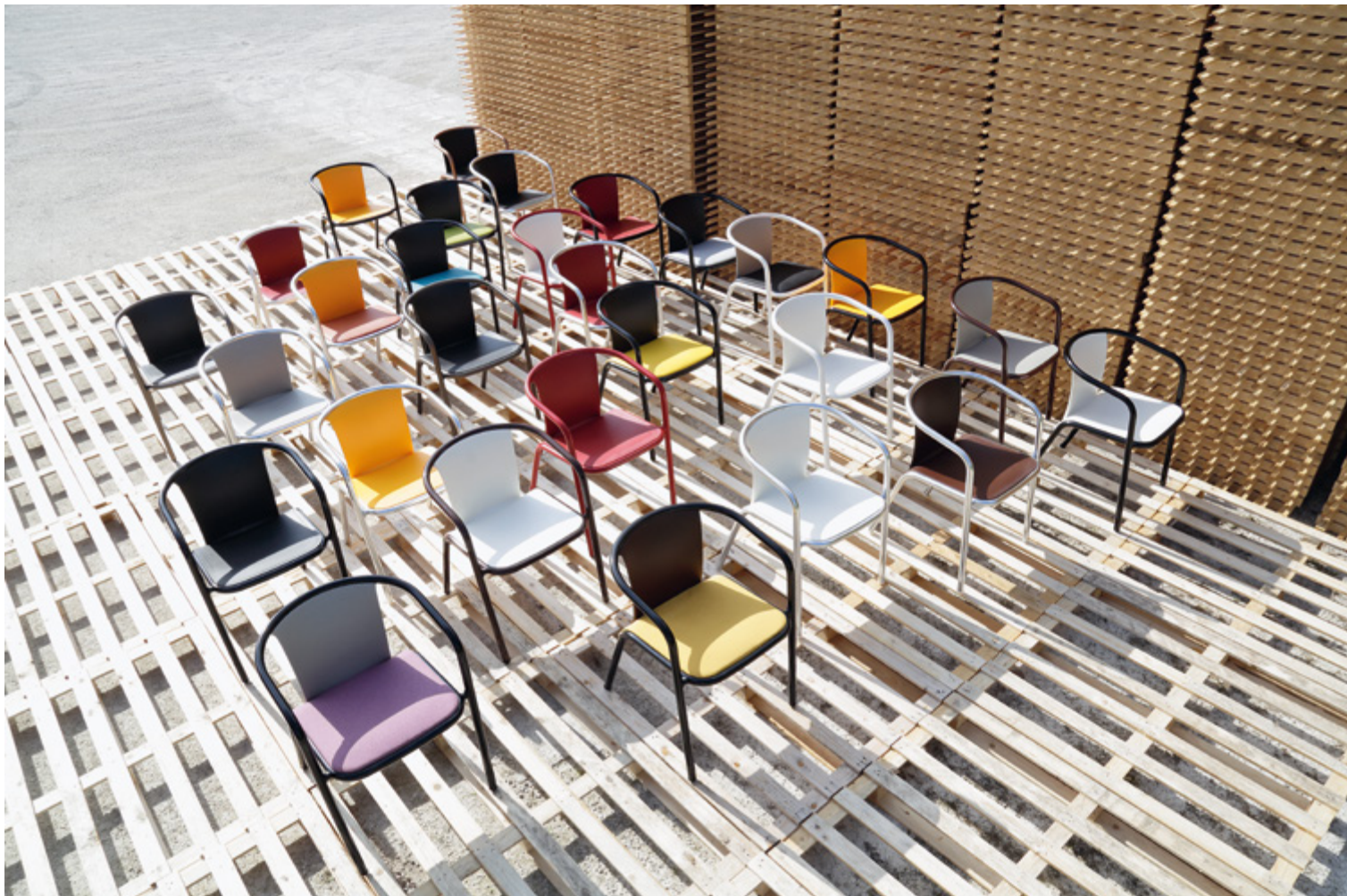
▼ Nassau széksorozat. Polipropilén, üvegszál- erősítéssel.