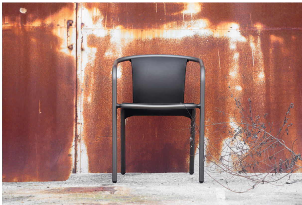
PIF. Polietilén kisbútor, kül- és beltérre egyaránt alkalmas.