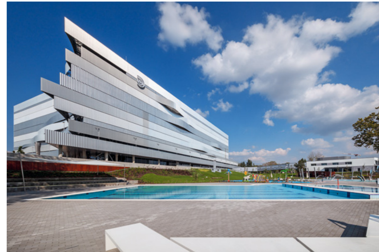
« A Duna Arénát és a Strandfürdőt összekötő zárt hídépület.