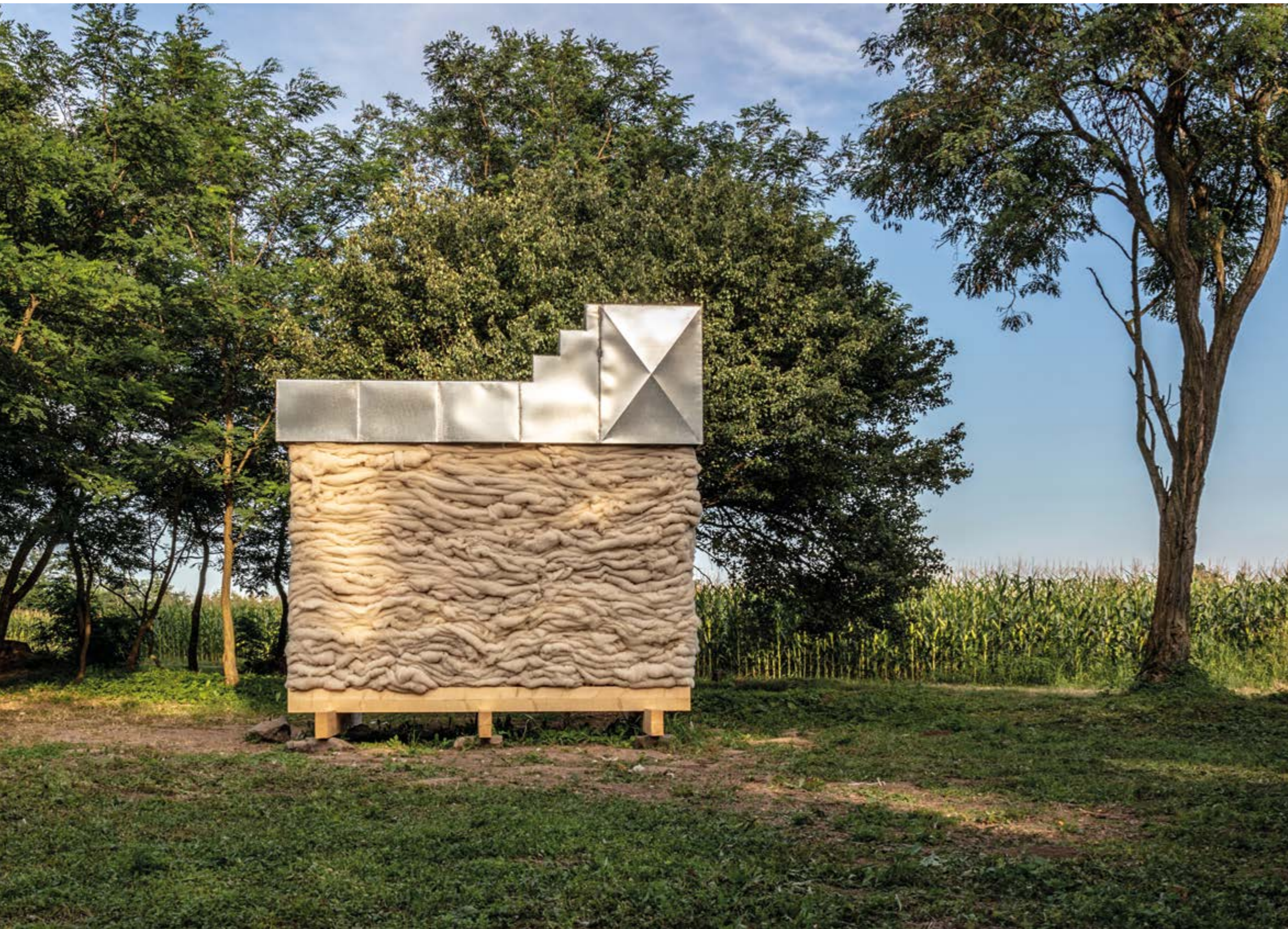
Architecture Uncomfortable Workshop + Lőw Márton: Hello Wool (gyapjúház)

háza, és nem utolsósorban az argentin IR arquitectura napenergiával működő pasz-szívháza is. Új korszakban lépett tehát a Hello Wood, ami a hazai kortárs építészet számára öröndetes tény. Beváltott ígélet, nem csak pusztá formalizmus, nem csak felhevült testek az izzó nyári tájban. (Nyitókép, frundgallina: Treehouse )