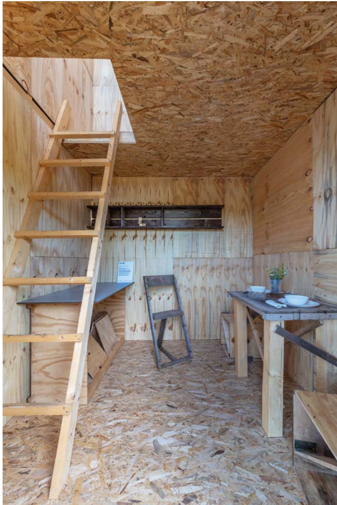
H3T architetti: Vertical Cabin