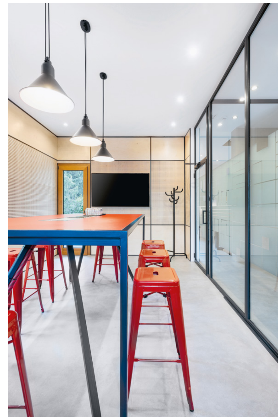
Az üvegfalok keretei acél zártszelvényekből készültek, ez a megoldás a bútorokon is megjelenik.