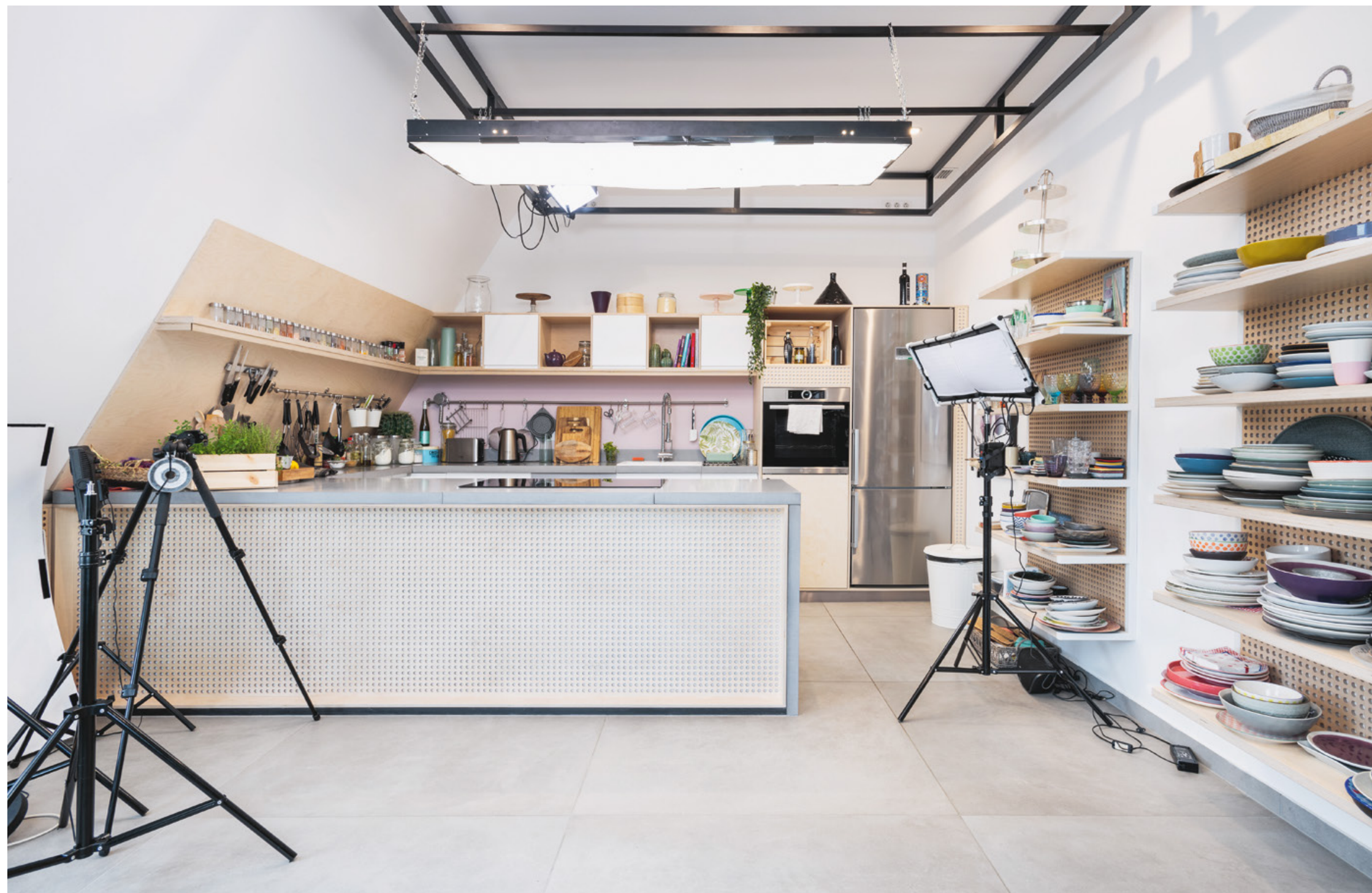
A közös konyha részlete.

a teljesen egyedileg tervezett bútorok is. A másik nagy kihívás a terek felosztása volt, tehát annak eldöntése, hogy melyik munkatárs hova ül majd. Mivel az üzleti folyamatokban sok jól elkülönülő munkafázis van, a tervezők a teljesen egybenyitott terek helyett inkább azt választották, hogy a különböző osztályoknak legyen saját, leválasztott irodája, emellett viszont az egész tér emeletenként legyen átlátható. Így vetődött fel az üvegfal-as portálszerkezetek ötlete, melyeknek köszönhetően a munkatársak