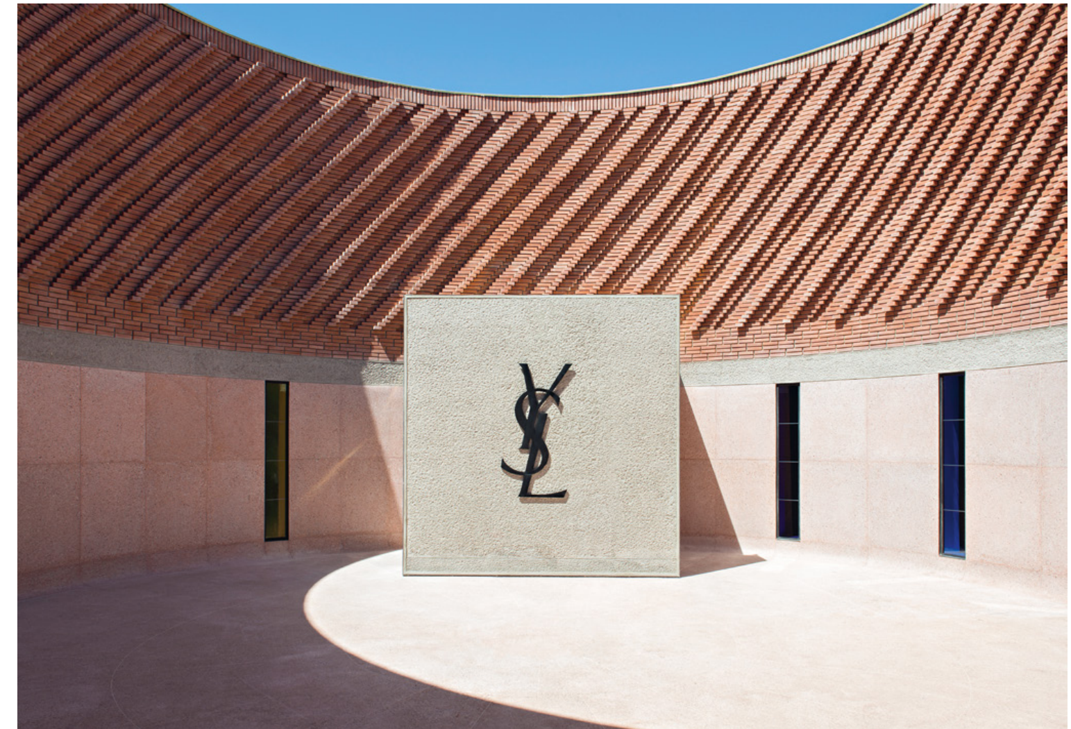
A bejárati patio.

A helyi gyakorlat szerint jórészt olívahulladékkal kiégetett téglákat alkalmaztak.