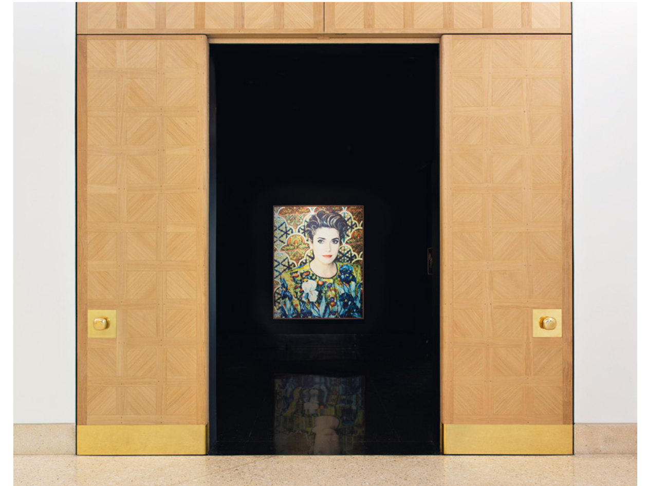
◀ Bejárat a fotógyűjteménybe.