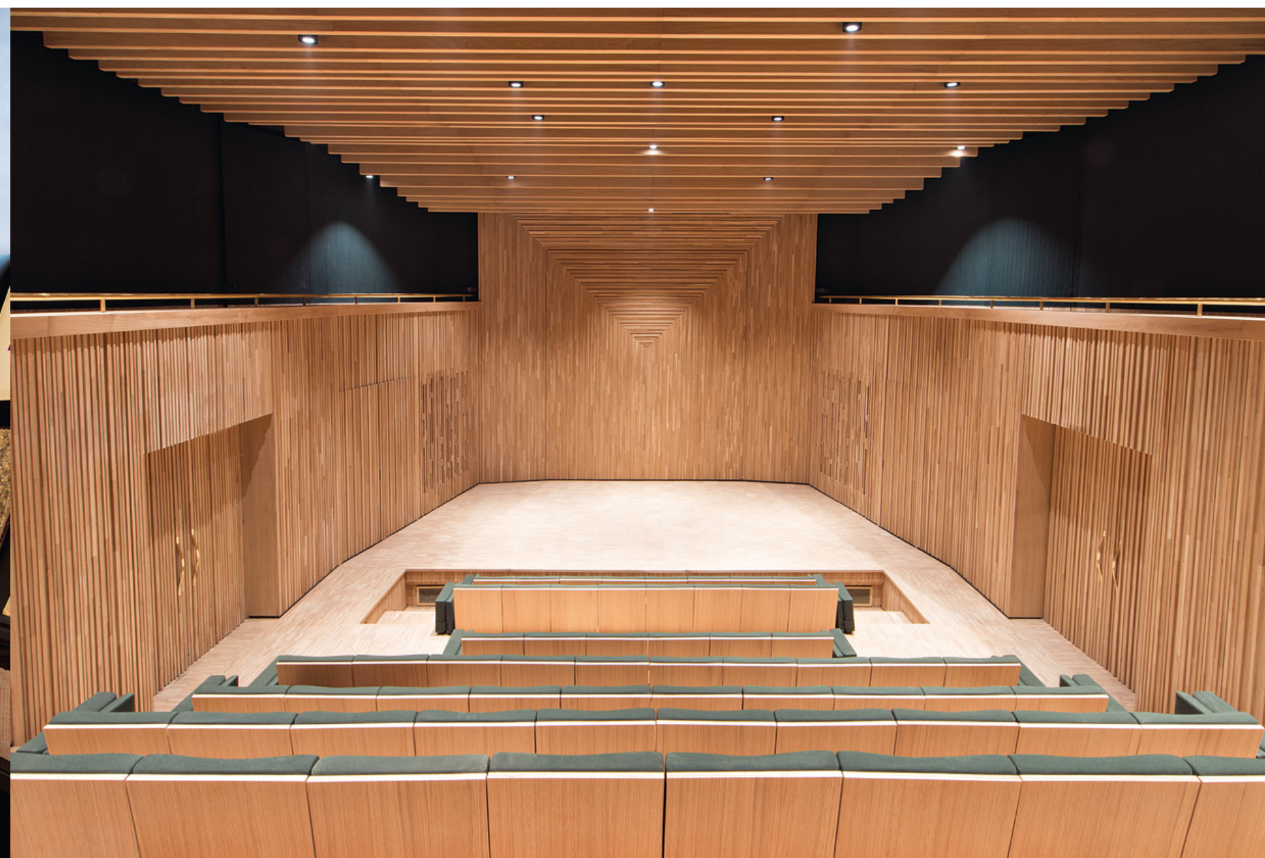
Pillantás a 150 főt befogadó előadóterembe.

Az átriumos csarnok ellentétes oldalán kapott helyet a szintén Christophe Martin berendezte 80 m 2 -es múzeum-shop, amely szellemiségében YSL párizsi prêt-à-porter üzletének Isabelle Hebey neves belsőépítész 1966-os enteriőrjét követi a francia Olivier Morgue designbútoraival, az amerikai Isamu Noguchi papírlámpáival. A múzeum másik zárt szárnyában pedig a 150 fős, faburkolatú előadóterem rejtőzik, ahol