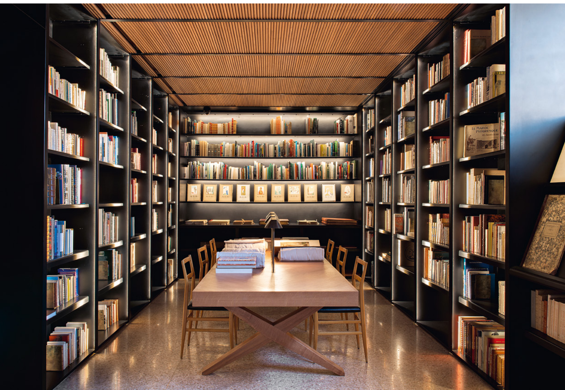
Az épületben szakkönyvtár is helyet kapott.

festő egykori műtermében látható.) Széles fakkerttel övezett üvegajtók mögül színes művek csalogatják a nézőt a múzeum két fő attrakciójára: YSL, illetve Majorelle munkásságának bemutatójára az épület utca felőli ablakaltalan szárnyában. Látványtervük a scenográfus/díszlettervező a honfitárs Christophe Martin tehetségét dicséri. A nagyobb (400 m 2 -es) helyiségben Bergé koncepciója alapján 50