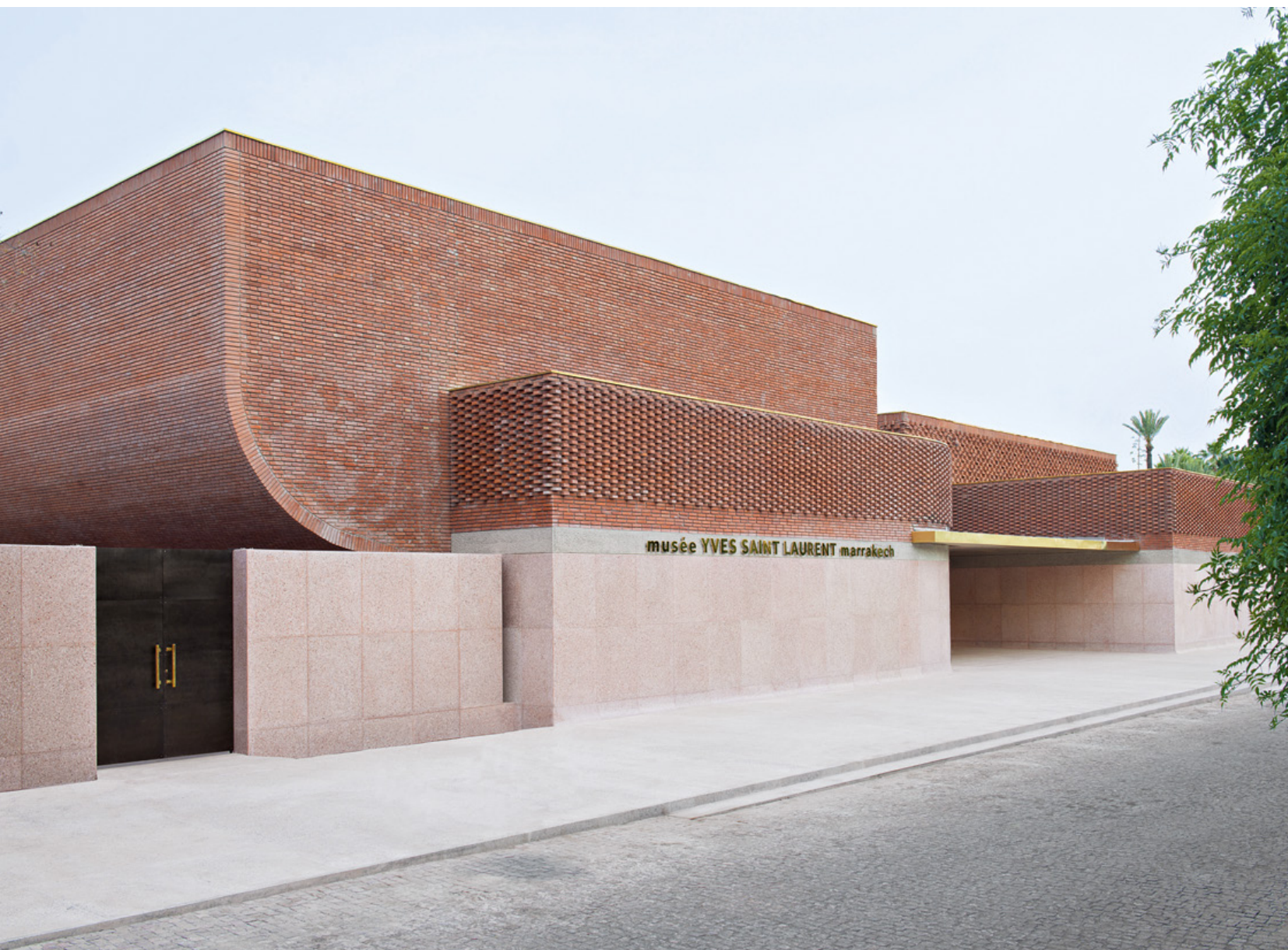
A múzeumépület részlete a főbejárattal.