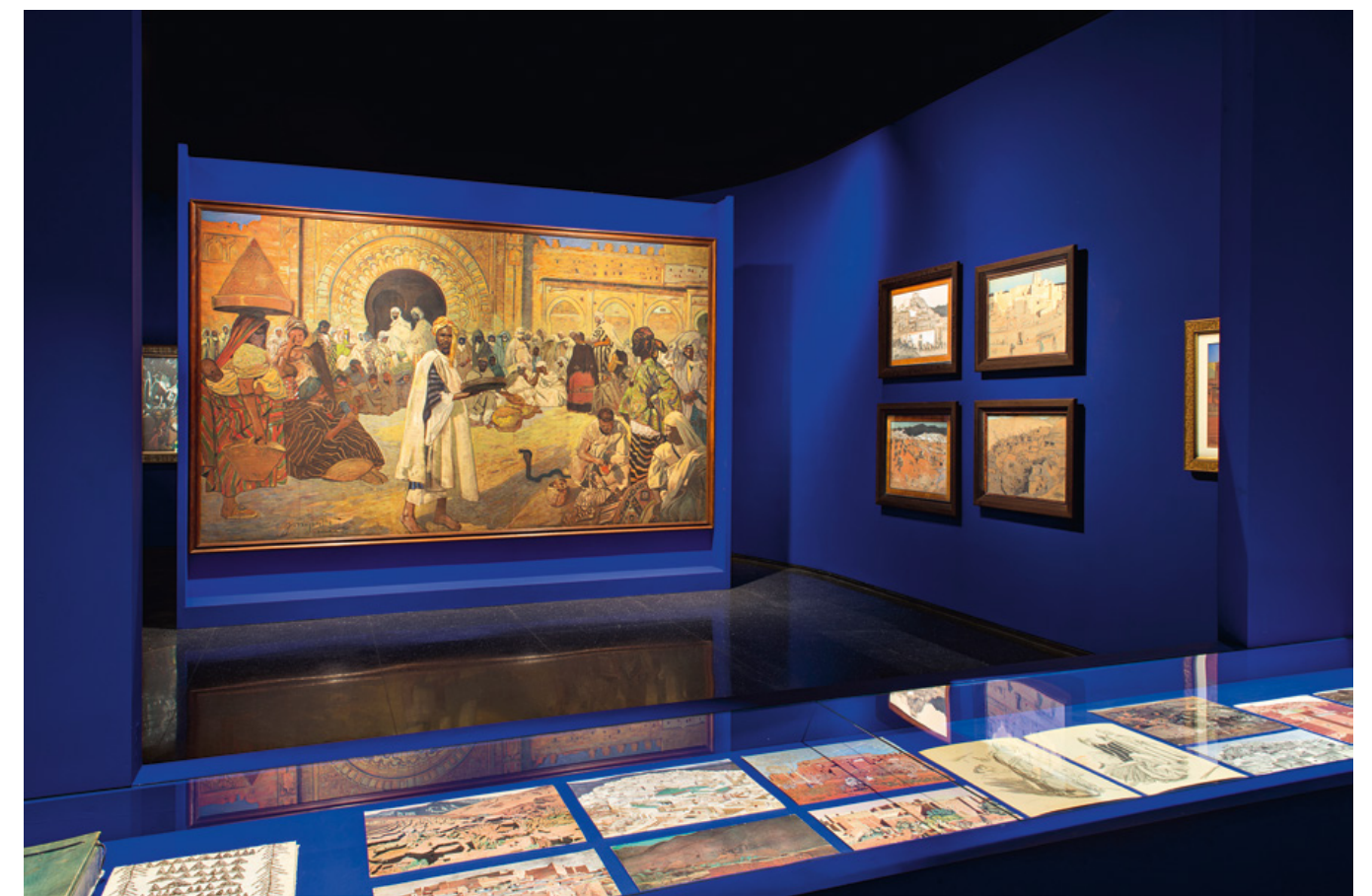
▼ Részlet a Jacques Majorelle életművét bemutató kiállításból.