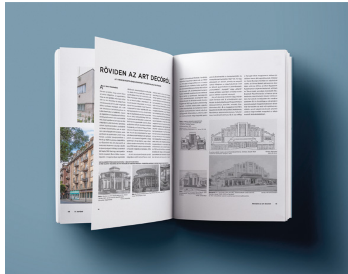
< Az Előszót rövid stílusáttekintés, majd magyar építészeti külföldi munkáinak épületjegyzéke következik.