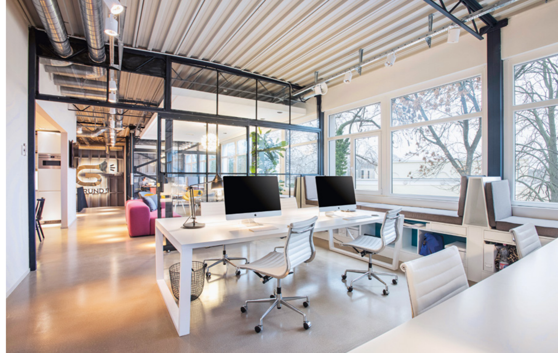
^ A vásárolt székek nagy része klasszikus design irodabútorok újrahasznosításai.