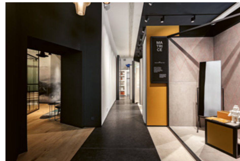
A CEDIT nagytáblás burkolatainak szentelt tér.

Balra az üvegfalú tárgyalóhoz vezető átjáró a Diesel Living/Foscarini Metal Glass lámpacsokrával, és az Inkiostro Bianco üvegszálás, feszített szövet hatású vinyl tapetája, a Tempesta részletével.