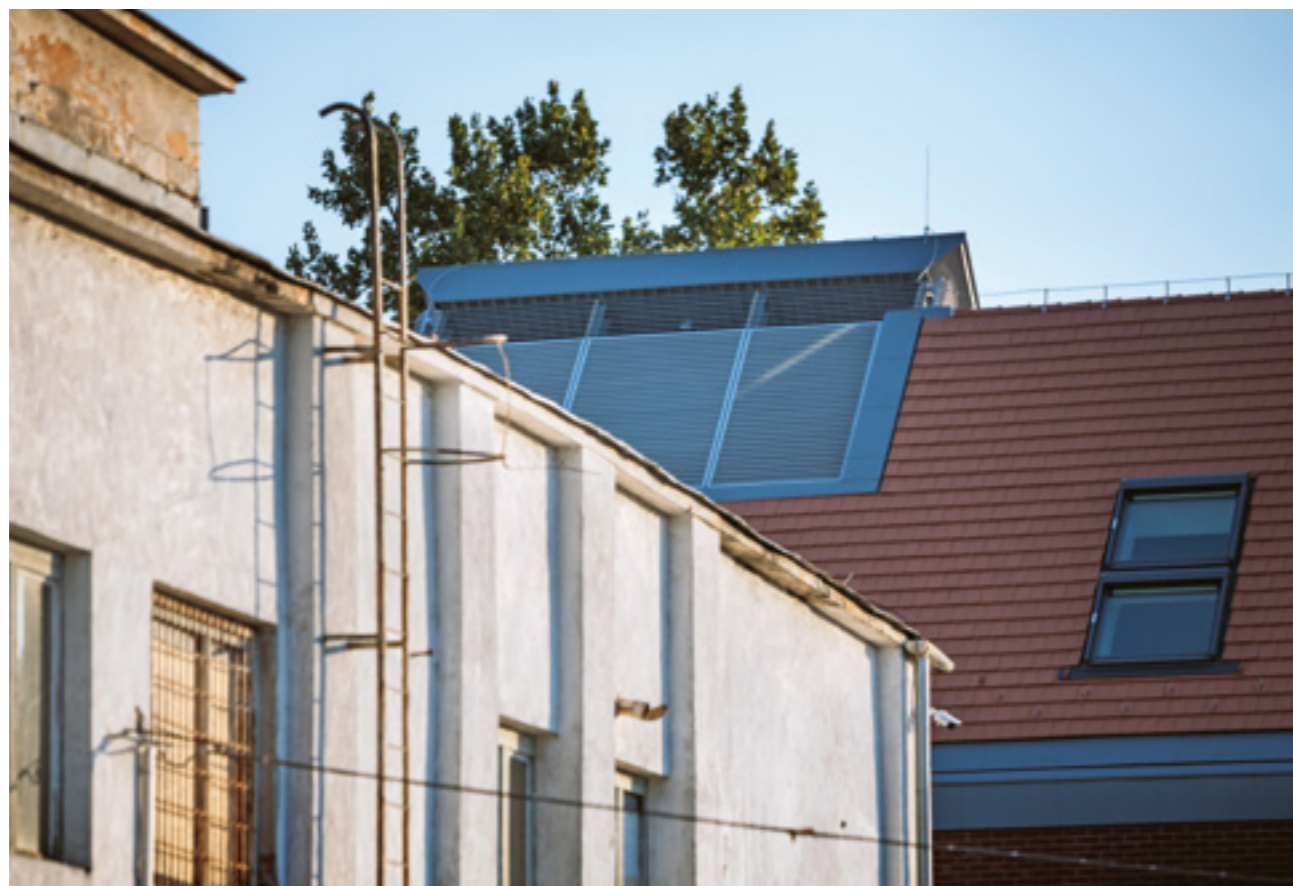
< A tetőteres bővítésben bújjik meg a gépészet.