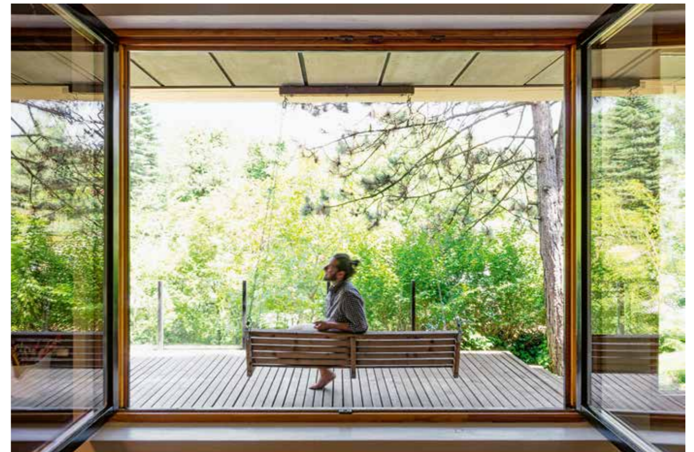
^ Nagy ablakokkal nyílik a nappali-étkező tere a terasz és kert felé.