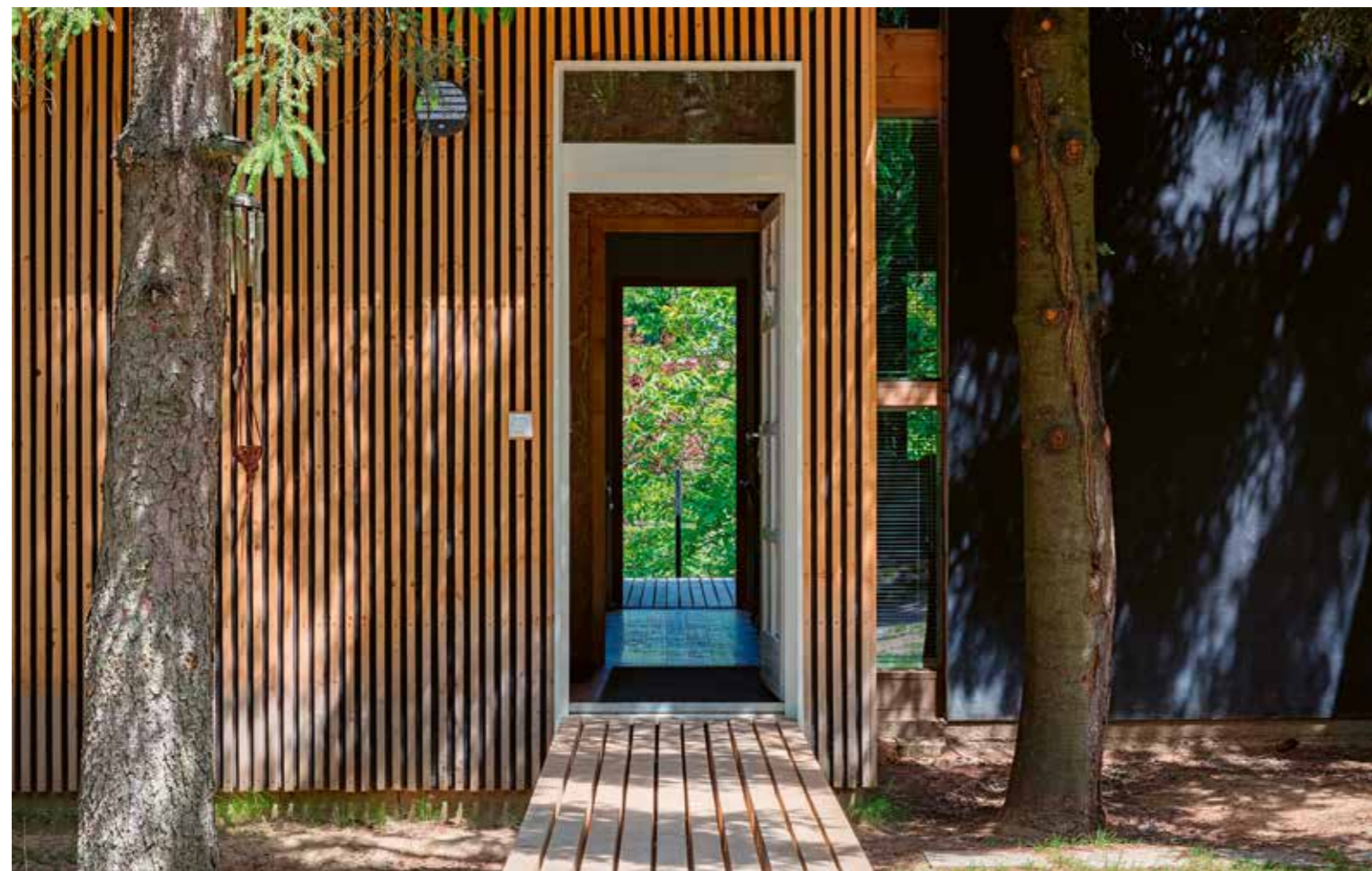
^ Egy hídszerű járdán érkezünk meg a ház előszobájába, nappalijába. Jobbra jól látható az a beharapás, amivel a homlokzati sík kikerüli az előkert két fenyőfáját.