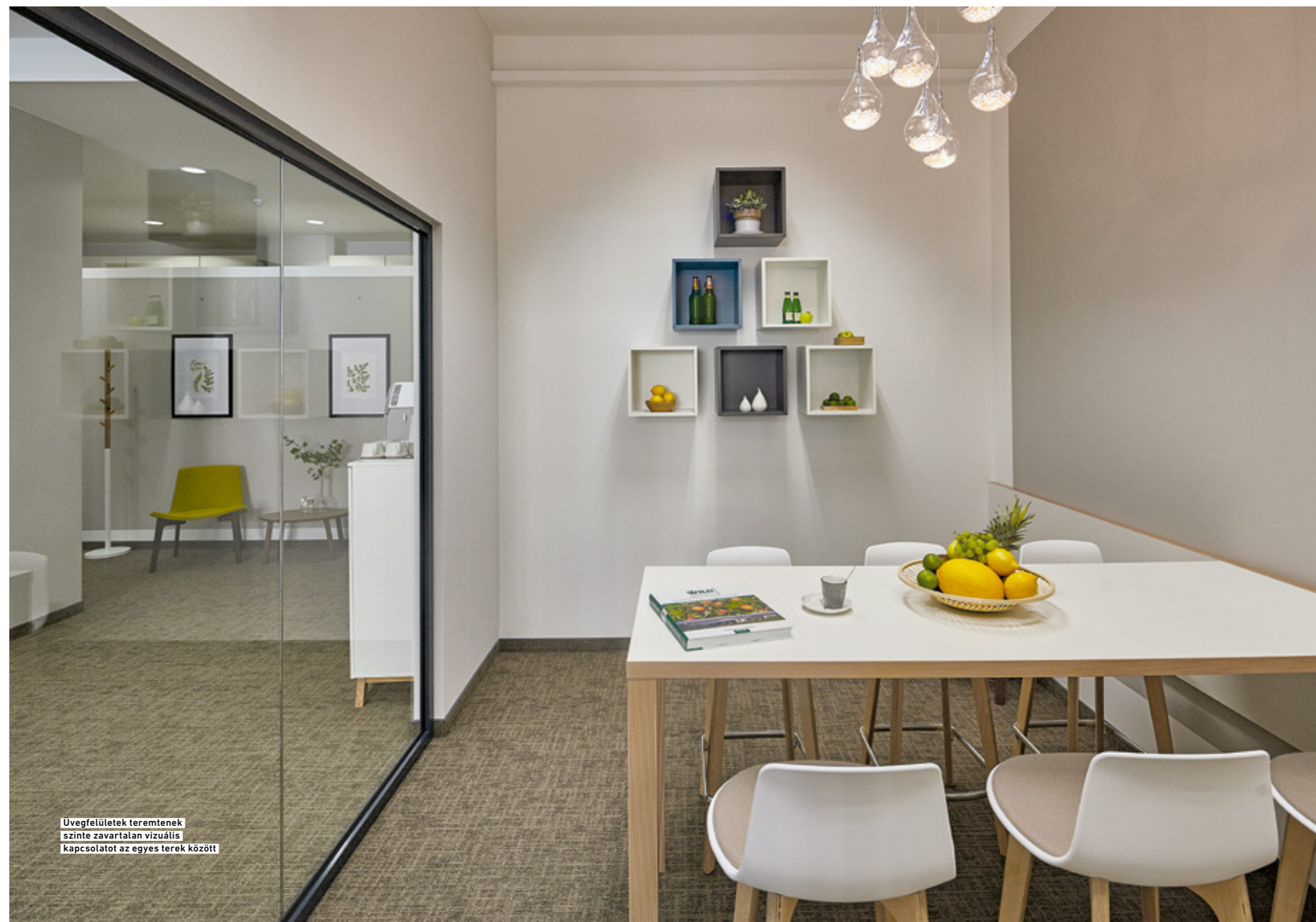
Üvegfelületek teremnek szinte zavartalan vizuális kapcsolatot az egyes terek között

ges szerepe azonban nem ez, hanem, hogy a tér fényhatásait is megváltoztatja: a fehér sávokon élénkebben tükröződnek vissza az iroda előtti kert visszfényei. A melegebb színekről emellett a sok természetes fafelület és a helyenként felragyogó sárga és zöld foltok gondoskodnak. Hogy a környezet nem válik a letisztult helyett kellemetlenül sterillé, az a szolid, de a minimál elemekből építkező térben meglepően kidolgo-