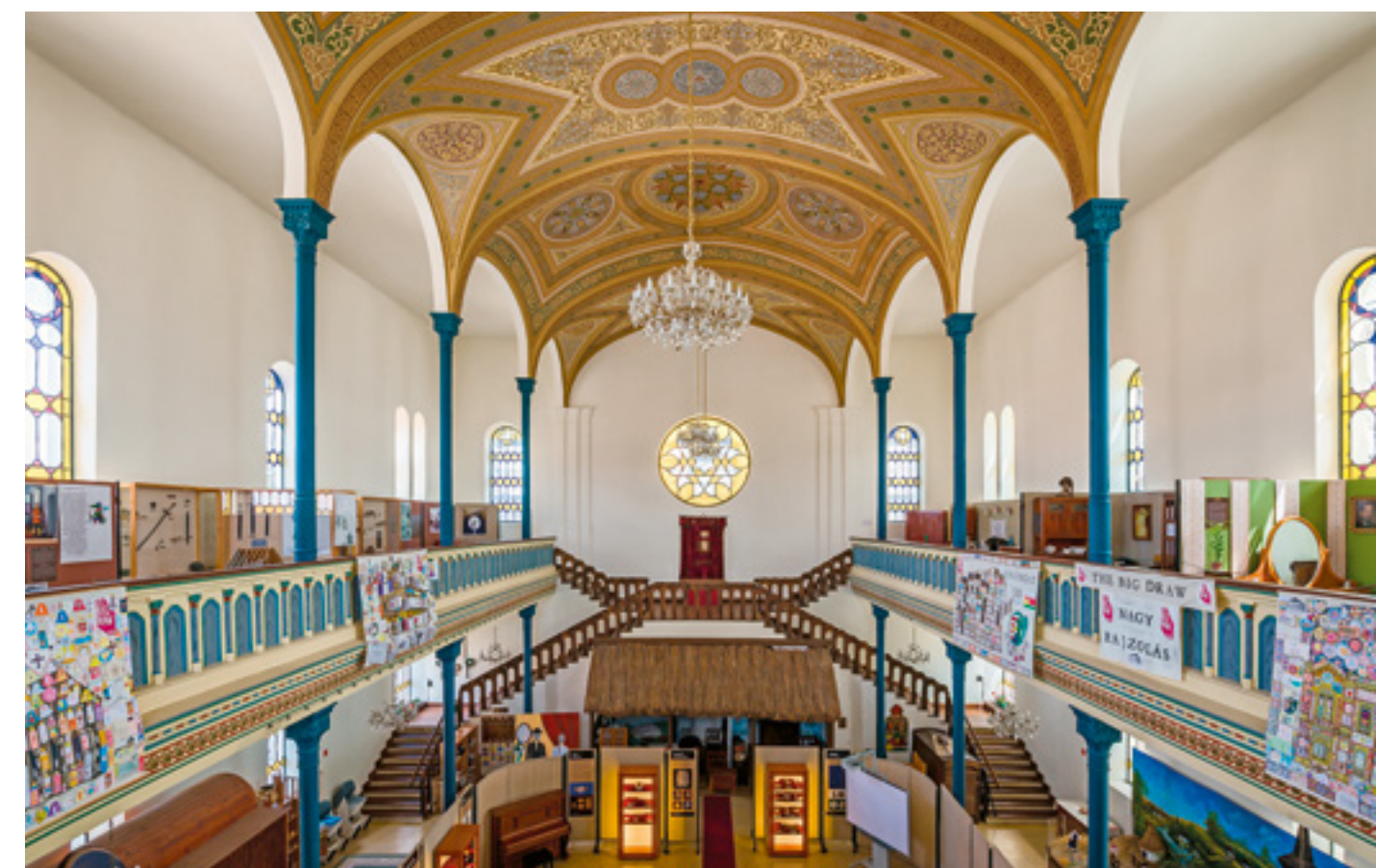
▲ Kiállítási tér a helyreállított díszítőfestéssel

ben történt meg. Falai között élénk hitélet zajlott egészen a második világháborúig, de mint a térség lényegében összes zsinagógája, a soát követően leromlott, elnéptelenedett. A háború után szakrális küldetését már nem tudta beteljesíteni, megújulva kulturális célokot szolgáló épületté vált, 1983 óta a Rétközi Múzeumnak ad otthont. Aztán eltelt 30 év, mire adódott a lehetőség, hogy az épület visszakapja eredeti szép-