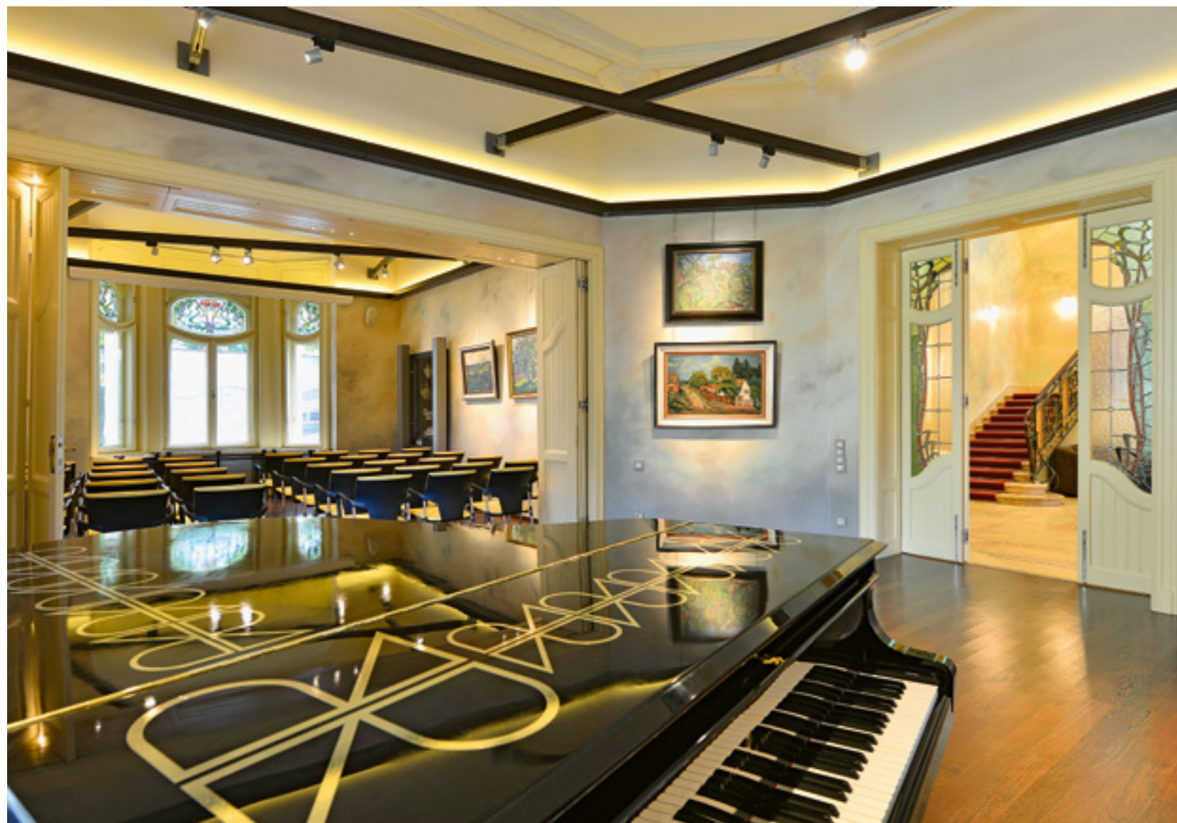
▲ A Körössy Szalon előadóterme a villa földszintjén