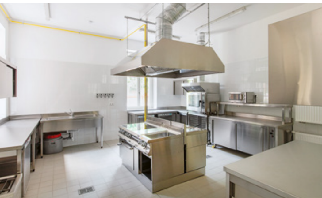
▲ Természetesen a mai igényekre szabták át az épület funkcióját

balluszteres terasz és erkély az épület vertikális jellegét hangsúlyozza, távolról felidézve a korabeli angol eklektika reneszánsz-központúságát.