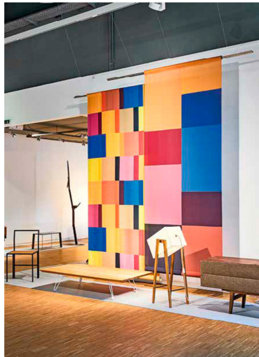
< A lett Raimonds Cirulis (Maffam) többszörösen díjazott, egyedi kézműves eljárással és bazalt alapú anyagból formált bútorai.