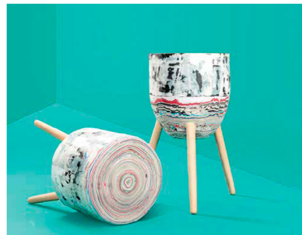
A cseh Kateřina Brůhová lerakóasztalkái reciklált papírból, fa lábakkal. (600 mm mg, 320 x 320 mm Ø).

körbeveszi mindennapjainkat (a.k.a. minden ember designer!) –, mégsincs kellő súllyal kezelve a hazai kultúra játéktérén.