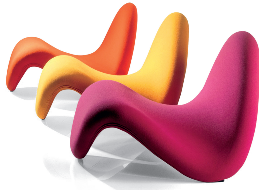
▲ F577 (Tongue) ülőke, 1967