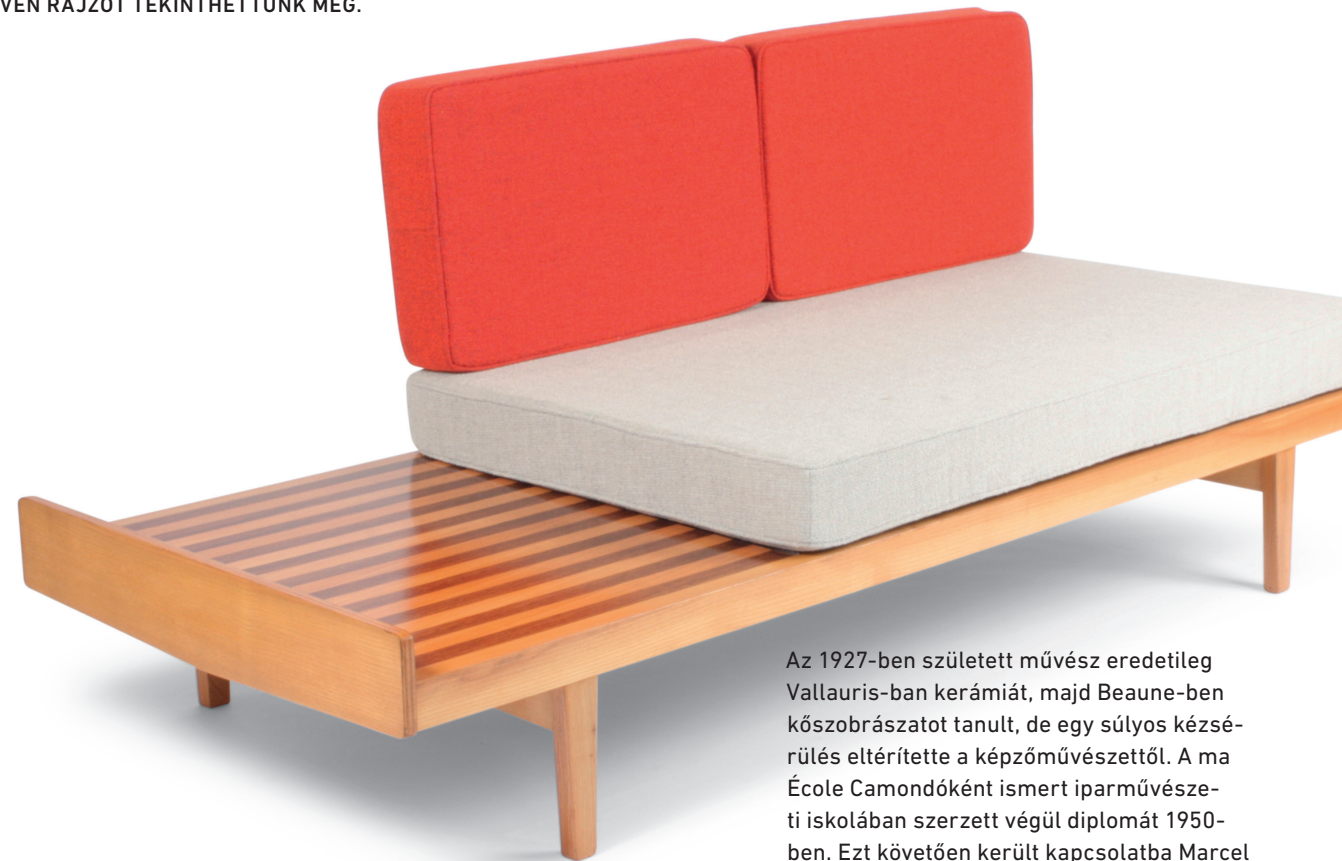
▲ 119 (Banquette) ágy, 1953/54

Az 1927-ben született művész eredetileg Vallauris-ban kerámiát, majd Beaune-ben kőszobrászatot tanult, de egy súlyos kézsérülés eltérítette a képzőművésztől. A ma École Camondóként ismert iparművészeti iskolában szerzett végül diplomát 1950-ben. Ezt követően került kapcsolatba Marcel Gascoinnal, akit – Jean Prouvéval egyetemben – a modern szériabútor legjelentősebb francia követeként tartunk számon. Nem volt merev funkcionalista; ő hívta fel a fiatal tervező figyelmét a bauhausi gyakorlatnál orga-