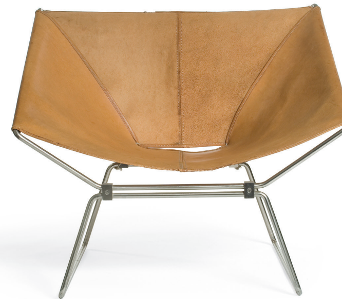
▲ AP 273 (Anneau) szék, 1954