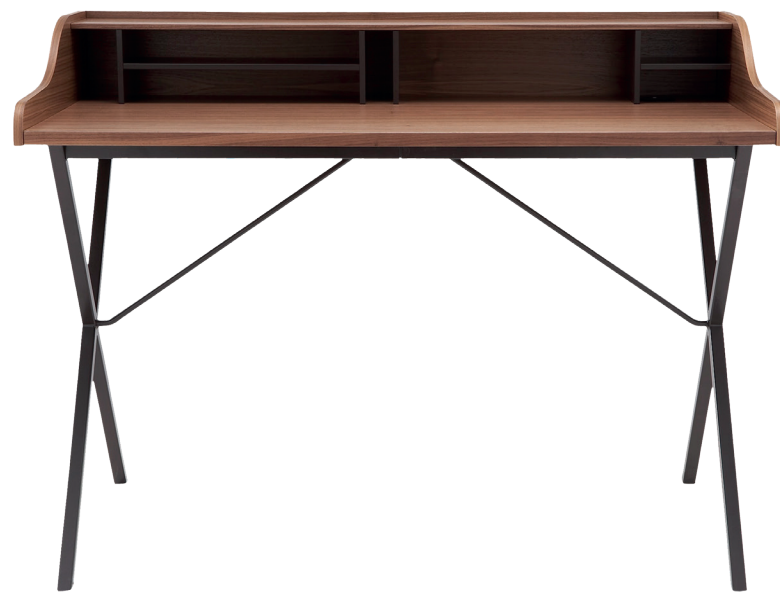
◀ CM193 (Női íróasztal), 1957 körül

lin alkotói képzeletét. Egymás után születnek a „vitális” plasztikával rokon (©Herbert Read for Henry Moore), merészen bizarr alakzatot öltő organikus ülőbútorai. A sort a hagyományos kagylófeltekt (bergère) megidéző Mushroom (1959) vezeti, majd ezt a darabot szabályosnak egyre kevésbé tekinthető olyan alakzatok követik, amelyek Pierre Paulin karakteresen popos stílusának produktumai. Ilyen az Orange Slice (1960), a Tulip (1965), a Ribbon chair (1966), a Tongue (1967), a Groovy (1972), amelyek közül némelyik még ma is futurisztikusan hat, jól illett tehát James Bond-filmek világába.