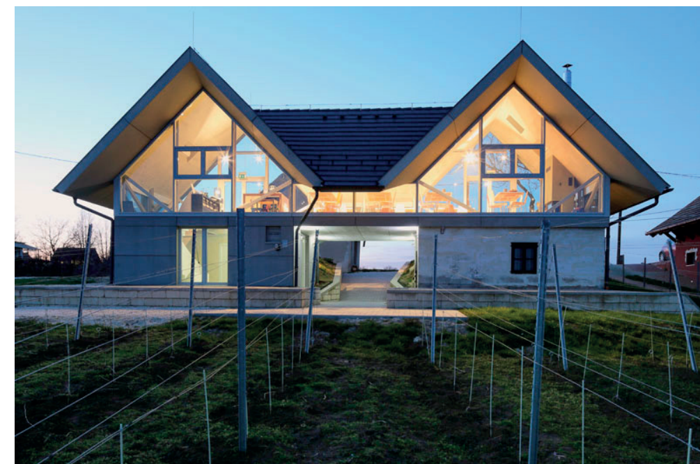
▲ Csodálatos kilátás nyílik a tőkék felé a kóstolótérből. Itt jól megfigyelhetőek a beton tetőidomok belső felületeinek textúrái

Az építészeti ikermotívum harmóniát és kiegyensúlyozottságot látat. Mint két bornak, két szőlőnek a „házasítása”, ami végül valami friss, izgalmas eredményre vezet. Ha építészeti párhuzamokat keresünk, akkor azt látjuk, hogy ez a megoldás úgy is egyedi, ha közben eszünkbe juthat akár Ekler Dezső győri pincésor-átírata (OCTOGON 2015/3),