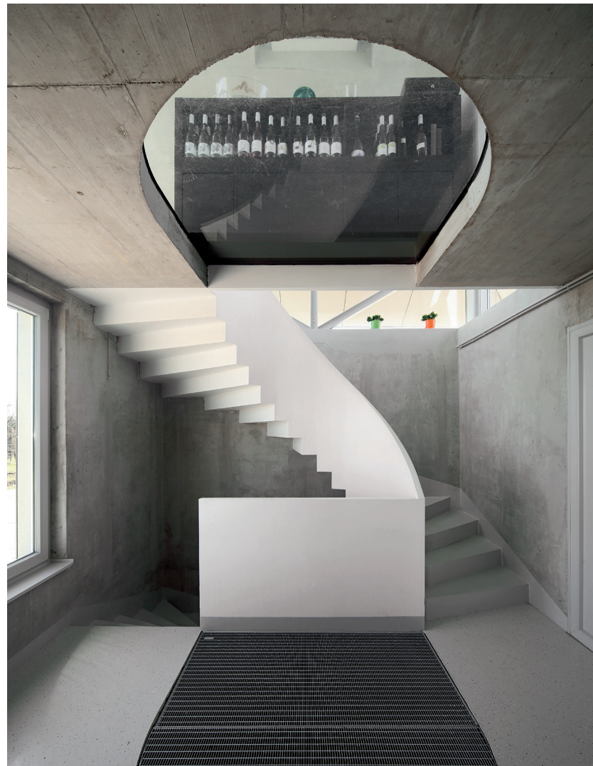
▲ Rendhagyó födémáttörések vezetnek le a természetes fényt a gyönyörű geometriájú lépcsőidom mellett