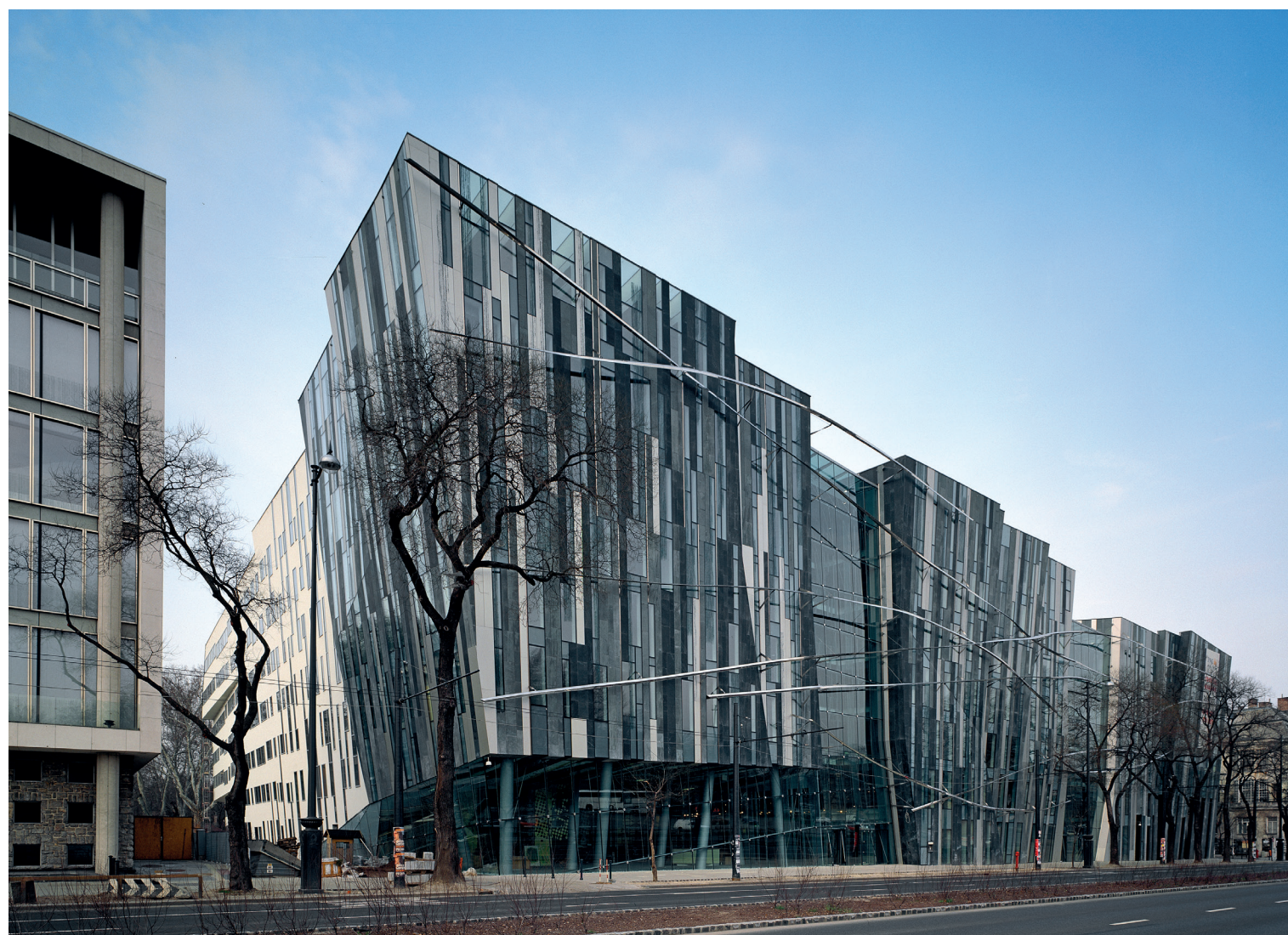
Bemutatóterem, Biaatorbágy; koncepcióterv: 2008