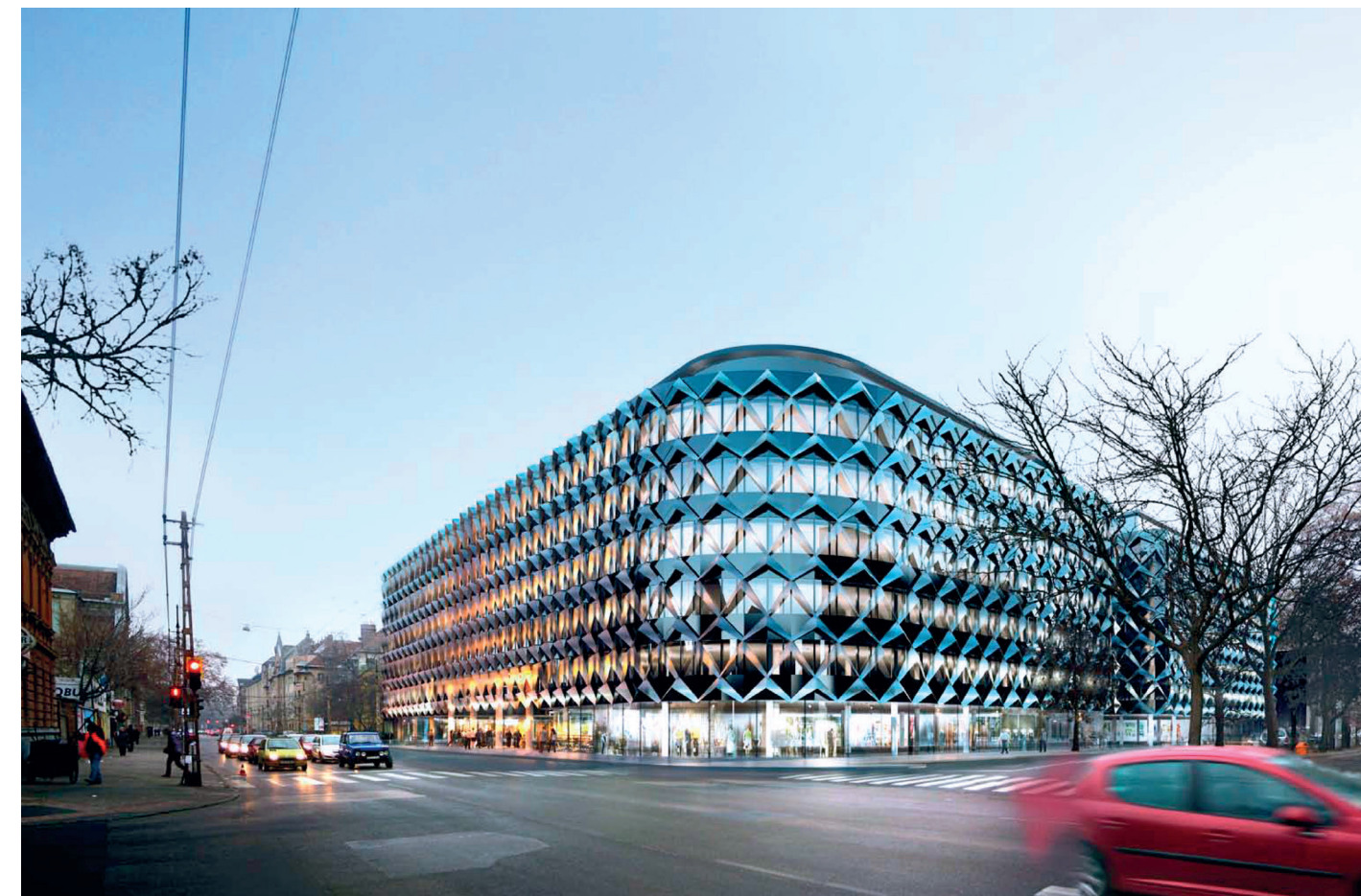
Irodaházterv a Dózsa György útra, Budapest; konceptióterv: 2009