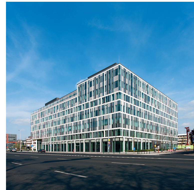
▼ Váci Greens irodaházak. Budapest; A épület; terv: 2008-; átadás: 2013