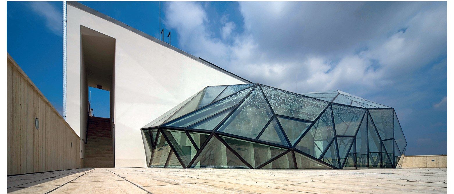
▲ Párizsi Nagyruház rekonstrukció és fejlesztés (tetőterasz részlet). Budapest; tervezés és építés: 2006-2009