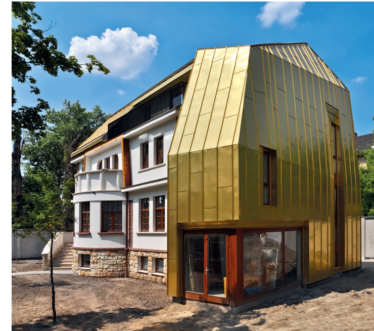
Lead System Hungary központ; terv: 2008-2009; átadás: 2010