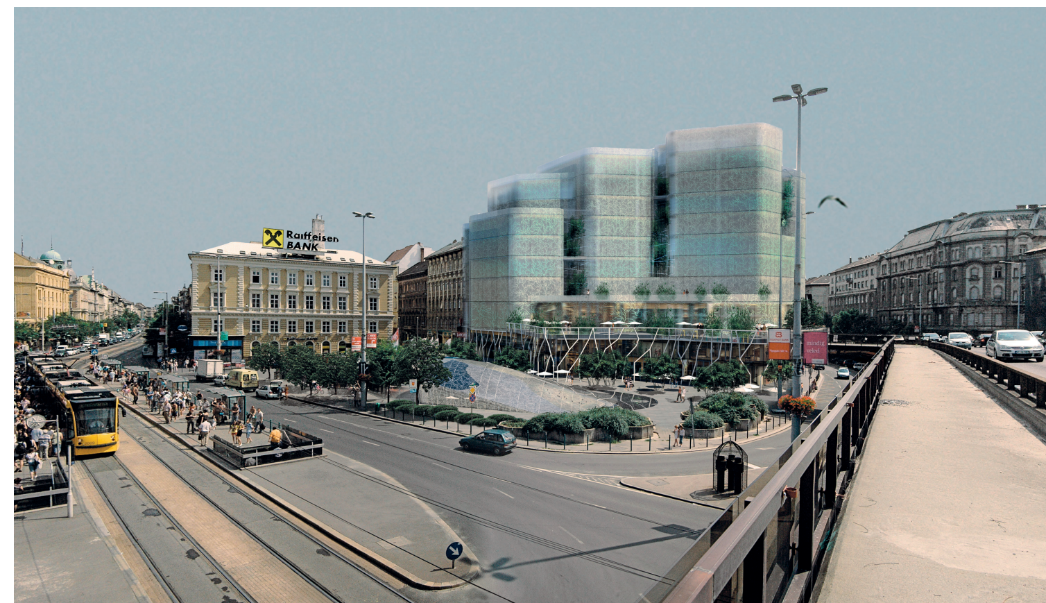
Skála Metró átalakítás, Budapest; koncepcióterv: 2008

kristály alakú üvegpavilon zárja: ég-közeli, poétikus ötödik homlokzat. A hazai és nemzetközi díjakat hozó áruház után irodaházak és városrésznői beépítési tervek következtek, köztük egy-egy kisebb léptékű munkával, melyekben a részletek kidolgozottsága ugyanolyan pontos, mint a szerkezeti tisztaság és a funkcióknak való megfelelés. Egy zuglói villát úgy alakított át egy cég székhelyévé, hogy az 1920-as évekbeli épületet körbevonta a vasbeton szerkezetre feszülő, aranszínű rézlemez borítású új résszel. Az új egység ezáltal szabályosan bekeretezi a hitelen helyreállított eredetit. Aztán a tervei nyomán elkészült a Váci út nagy irodaház-komplexumának, az öt tömbből álló Váci Greens-nek az első eleme, és lassan követi a szabályos utcarendre ülő, terekkel, sétányokkal körülvett többi is. Az elkészült épület könnyed, jó arányú, homlokzatkiosztása és az azon megjelenő ötletszerű pálcasormintázat feloldja a hatemeletnyi tömeg méretét, a közéjük ékelődő kerámiabetékek meglevenednek a folyton változó fényben. Valami könnyed lüktetés vonul végig a házon. Az Iparművészeti Múzeum